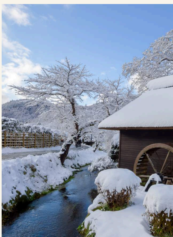
หมู่บ้านโอชิโนะฮักไก

วันที่ 1 : สนามบินนาริตะ - หมู่บ้านโอชิโนะฮักไก - ทะเลสาบคาวากุจิโกะ - จุดชมวิวฟูจิ