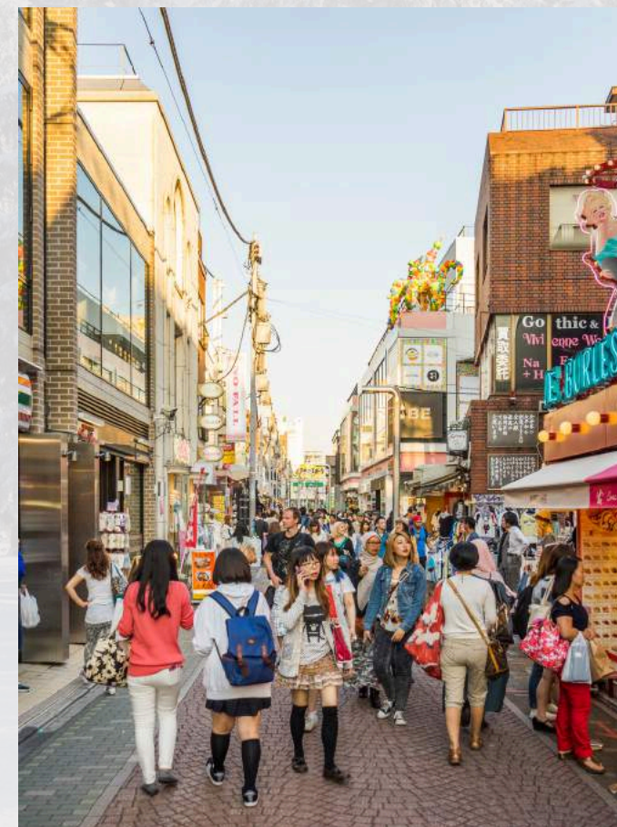
ฮาราจุกุ