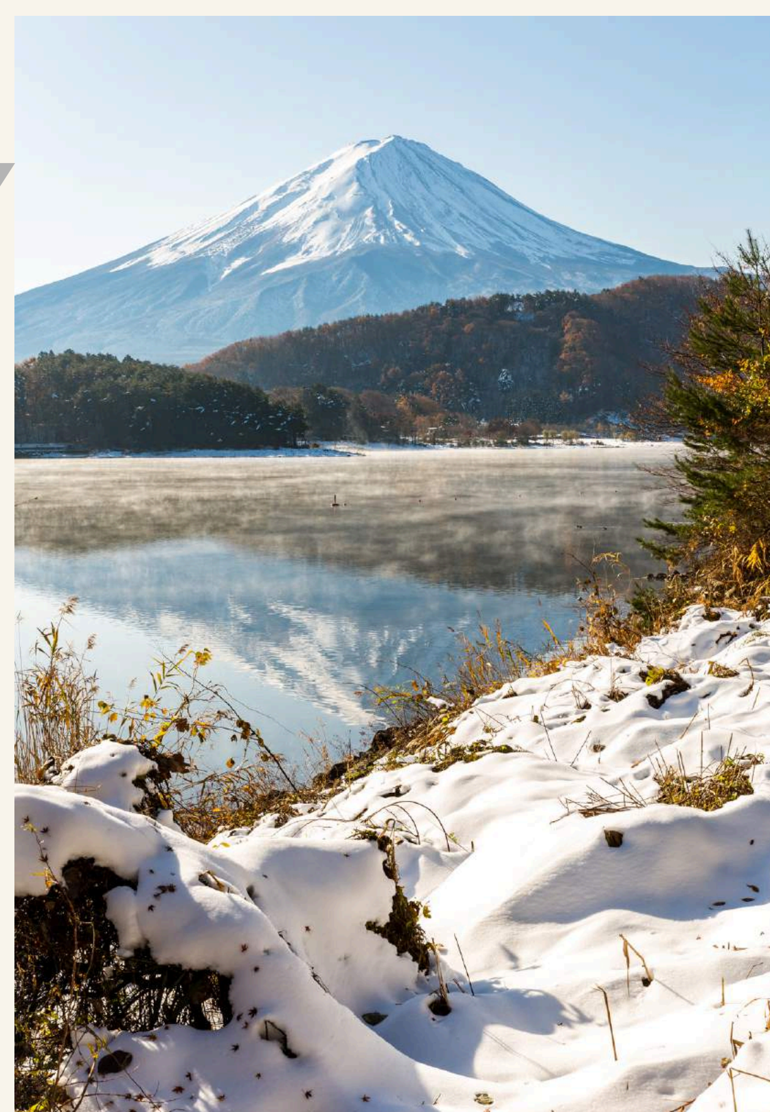
จุดชมวิวฟูจิ