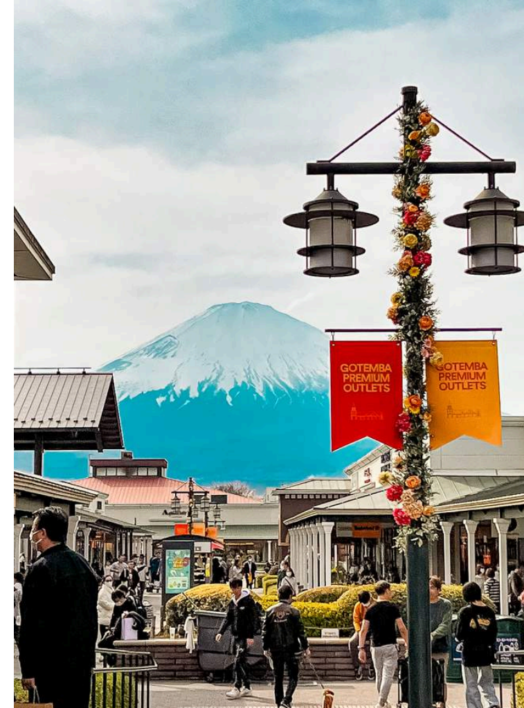
โทเทมบะเอาทเล็ก

วันที่ 3 : เมืองเก่าคาวาโกเอะ - ย่านชินจูกุ