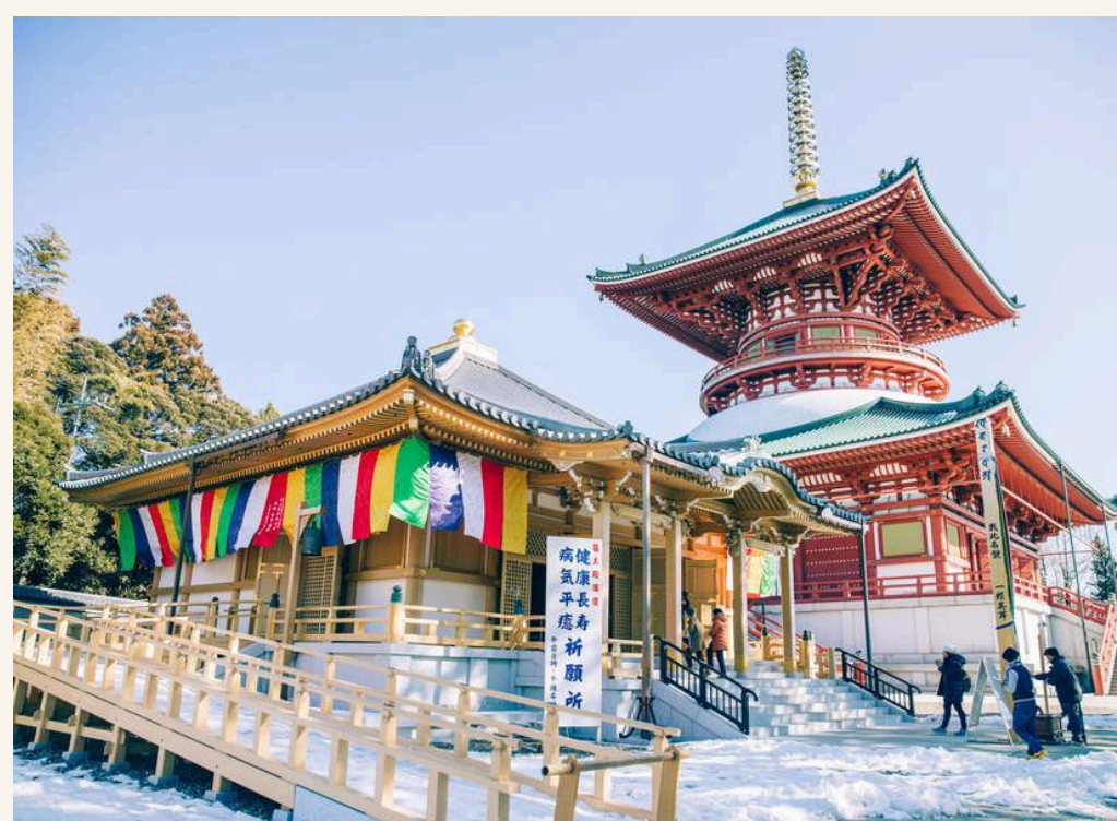
วัดนาริตะ