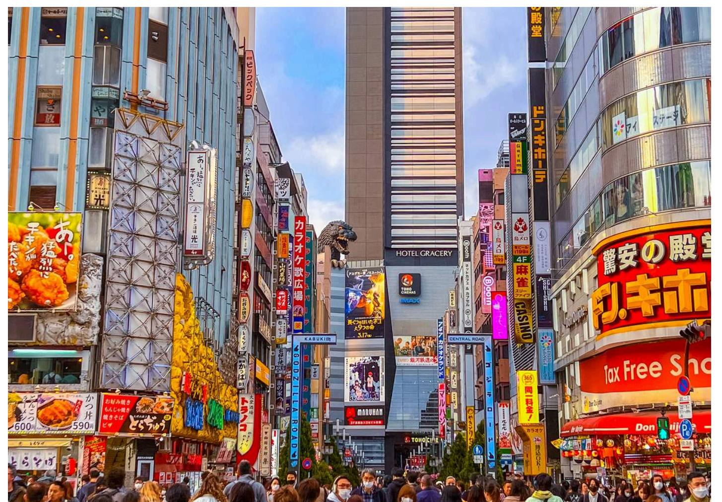
ย่านชินจูกุ

Just not a journeys, but it's your memory