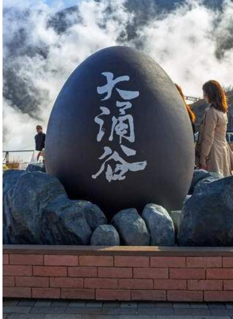
โอวาคุดานิ

วันที่ 2 : โอวาคุดานิ - ล่องเรือโจรสลัดทะเลสาบอะชิ - Mishima Skywalk - ช้อปปิ้งโทเทมบะเอาทเล็ก