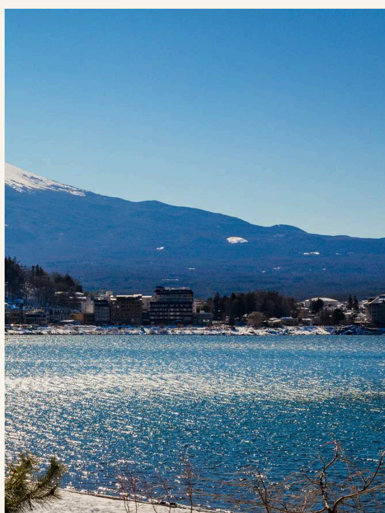
ทะเลสาบคาวากุจิโกะ