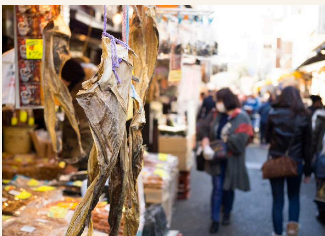
ตลาดปลาซึกิจิ