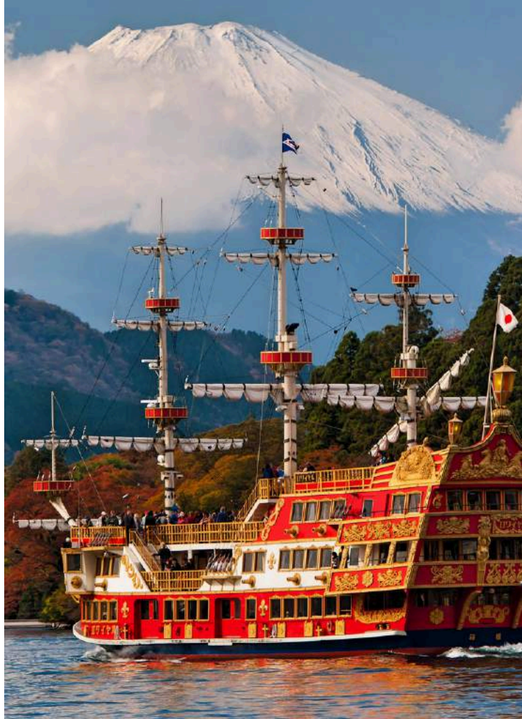
ล่องเรือโจรสลัดทะเลสาบอะชิ