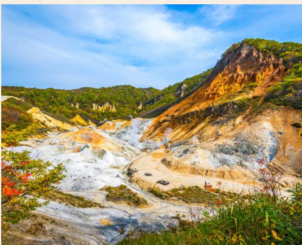
โนโบริเบ็ทสึ

วันที่ 1 : สนามบินชิโตเซะ - โนโบริเบ็ทสึ - หุบเขาจิโกกูดานิ - ทะเลสาบโทยะ