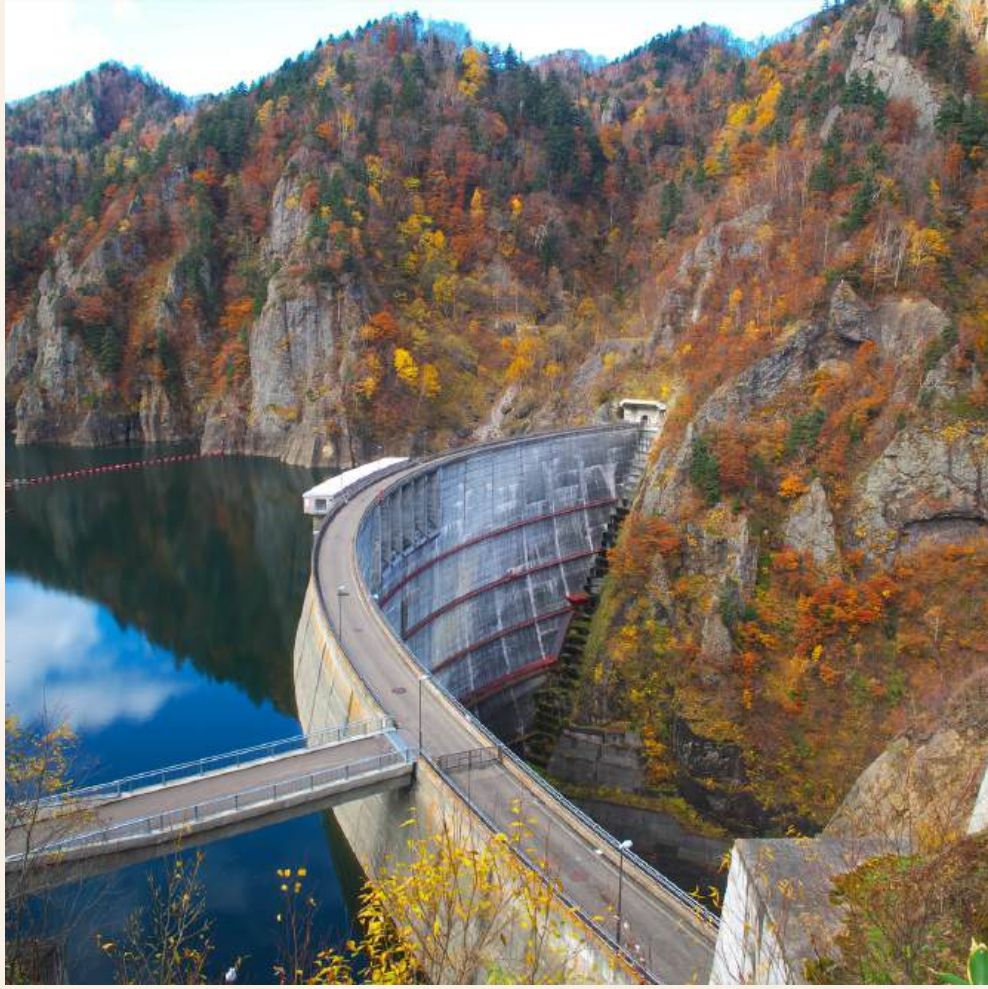
เชื่อนโฮเฮเคียว