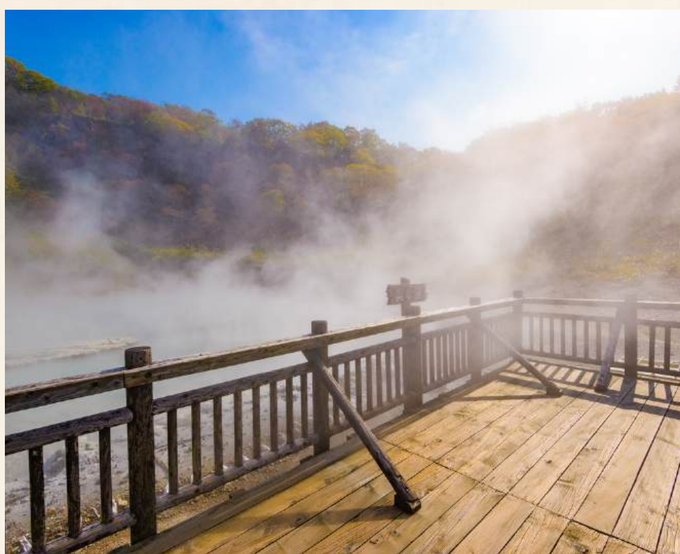
หุบเขาจิโกกูดานิ