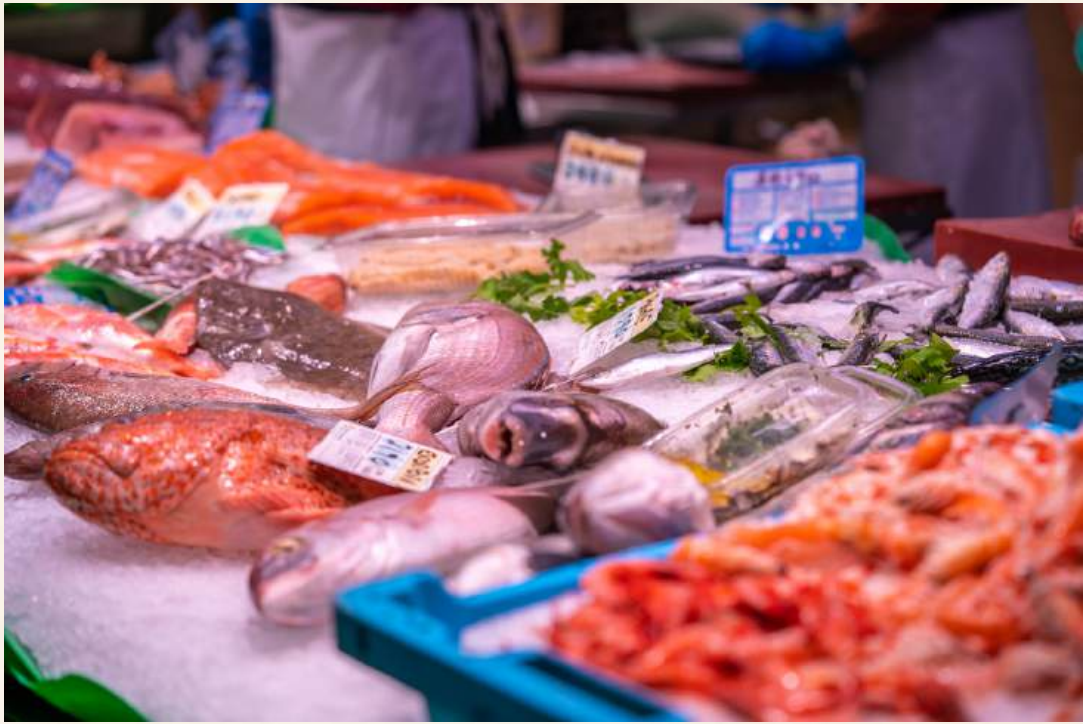
ตลาดปลาชิโงะ