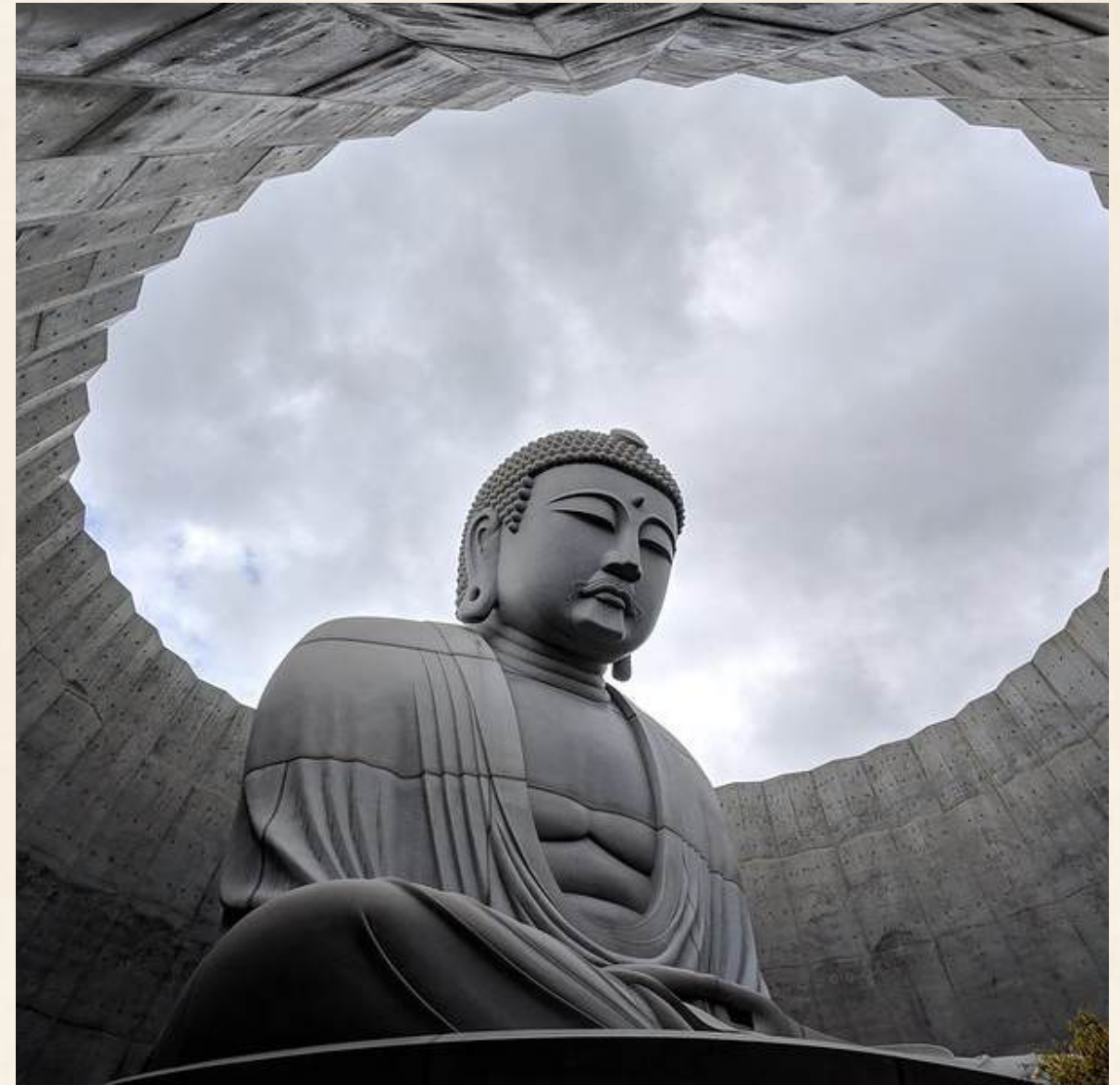
เนินแห่งพระพุทธรเจ้า