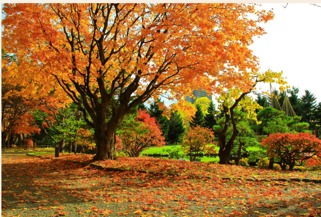
สวนนากาจิมา