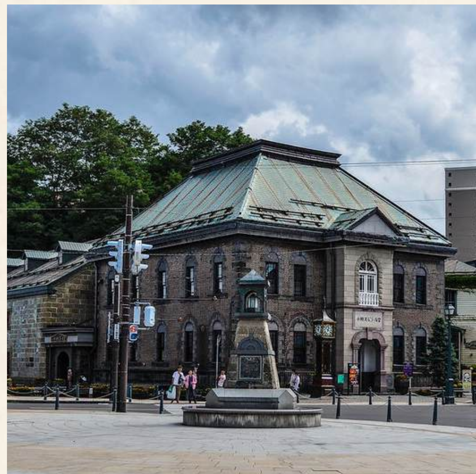
ซาโกมาจิ