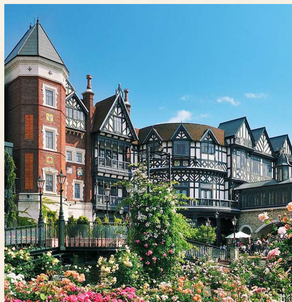
โรงงาน ชอกโกแลต