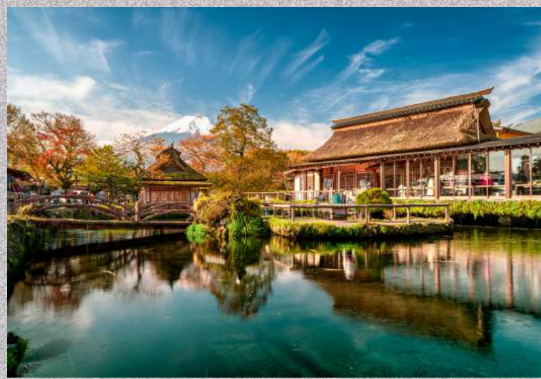
หมู่บ้านโอชิโนะฮักโกะ