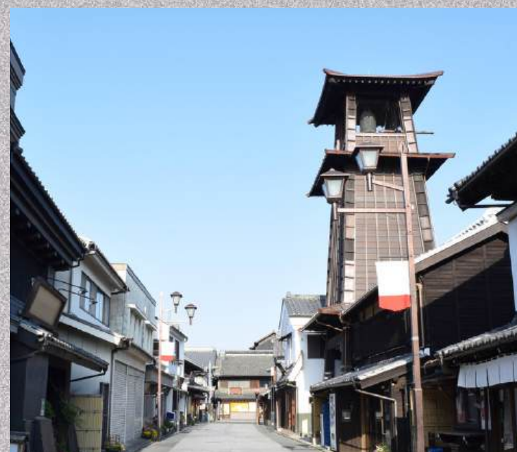
ย่านเมืองเก่าคาวาโกเอะ