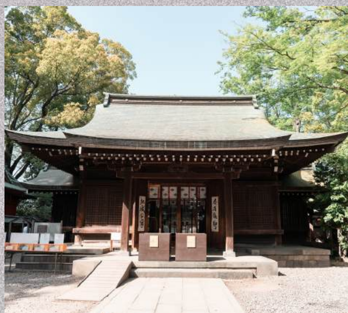
ศาลเจ้าอิกาวะ