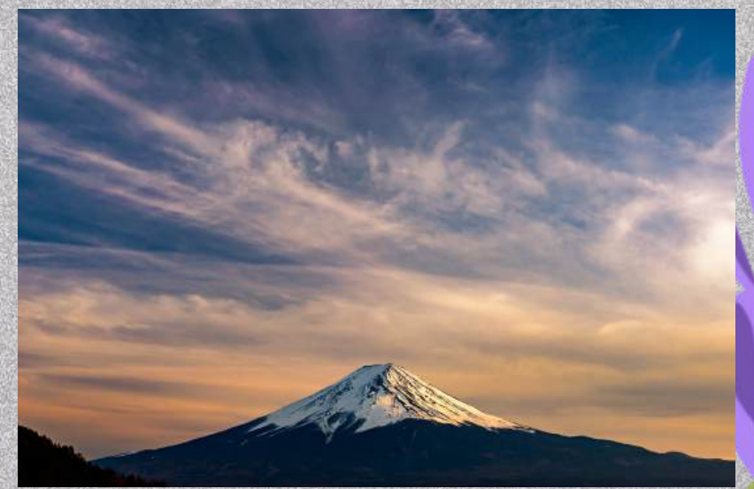
คาวากุจิโกะ