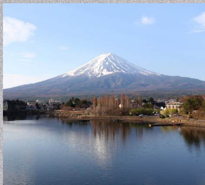
วิวรอบๆ ทะเลสาบ คาวากุจิโกะ

วันที่ 2 : วิวรอบๆ ทะเลสาบคาวากุจิโกะ - ย่านเมืองเก่าคาวาโกเอะ - ศาลเจ้าอิกาวะ - โตเกียว - ชินจูกุ