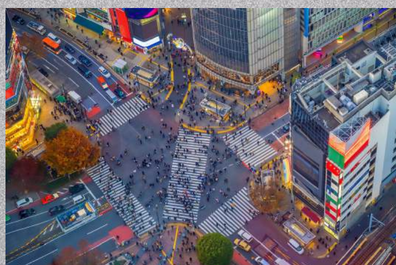
ชิบูย่าสกาย