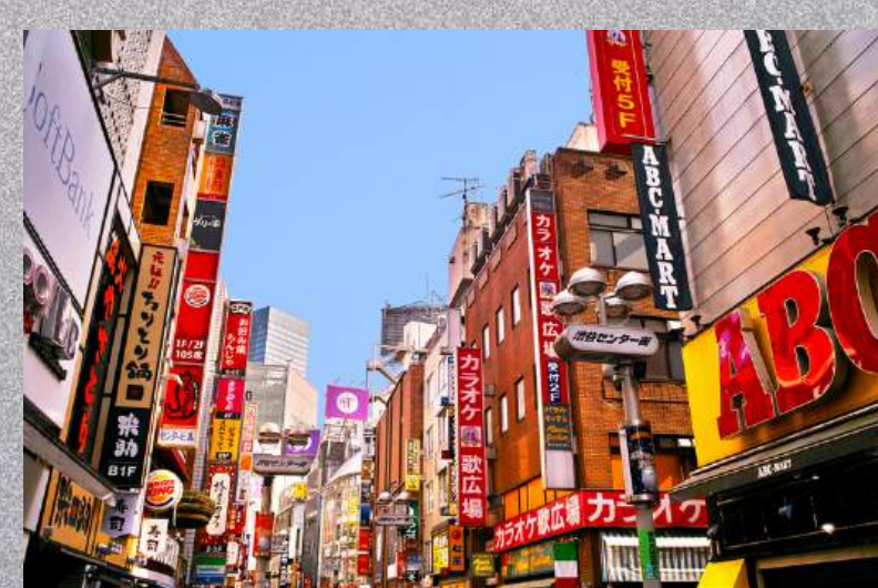
ช้อปปิ้งย่านชิบูย่า