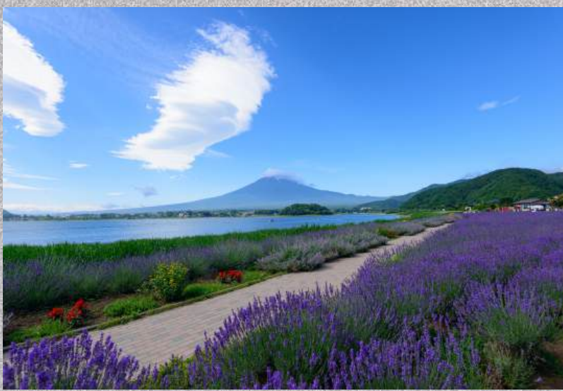
สวนดอกไม้ฮานะโนะมียาโกะ หรือ เทศกาลชมดอกลาเวนเดอร์ ที่ทะเลสาบคาวากุจิ

วันที่ 1 : สนามบินนาริตะ – สวนดอกไม้ฮานะ โนะมียาโกะ หรือ เทศกาลชมดอก ลาเวนเดอร์ที่ทะเลสาบคาวากุจิ – หมู่บ้านโอ ชิโนะฮักโกะ - คาวากุจิโกะ