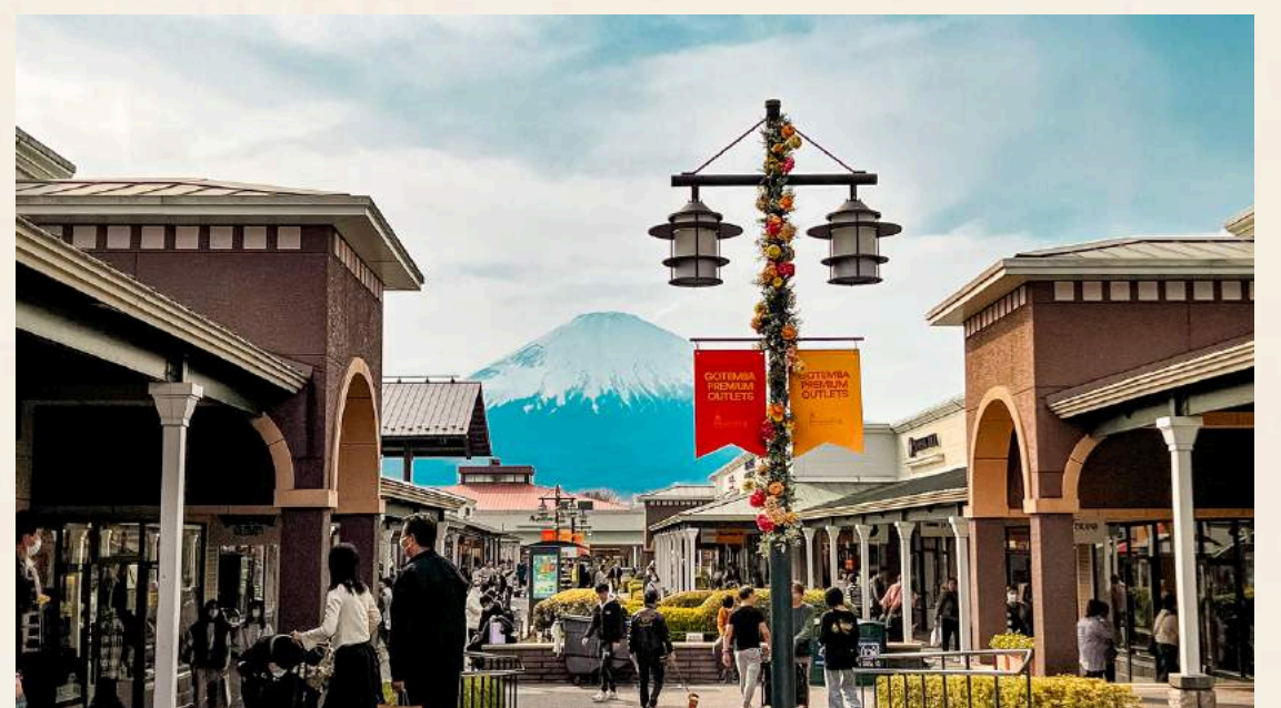
โทเทมบะเอาต์เล็ต