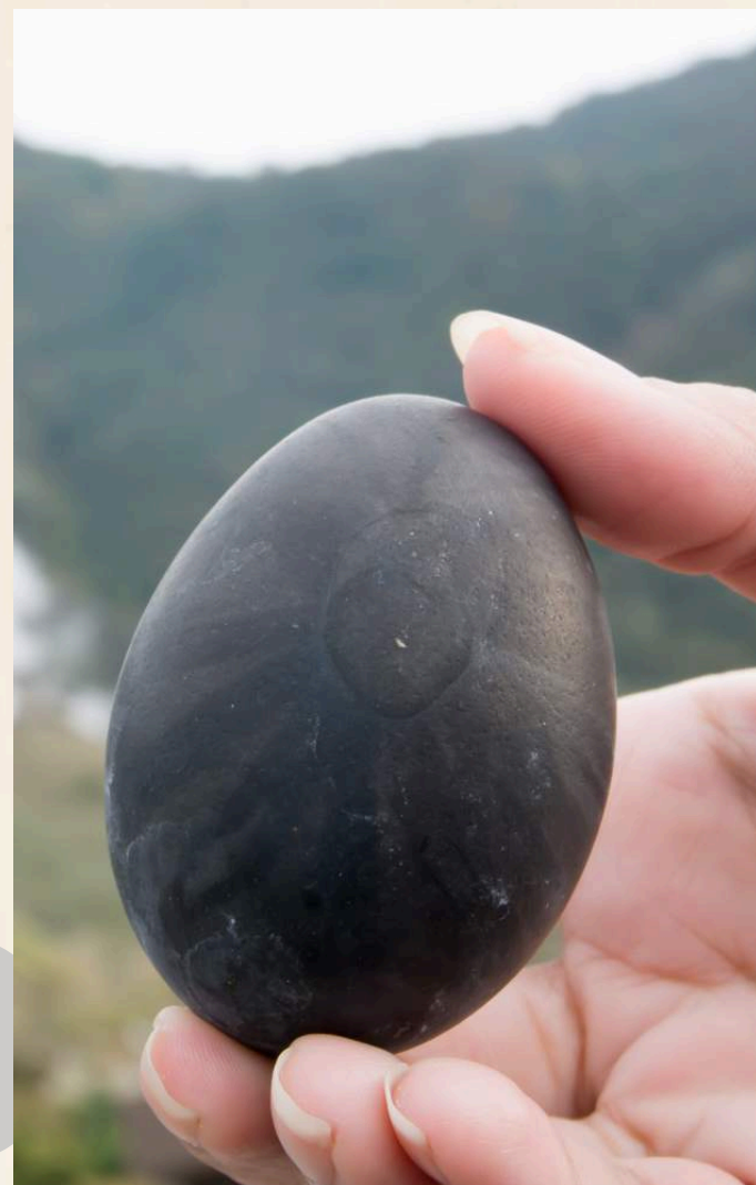
โอวาคุดานิ