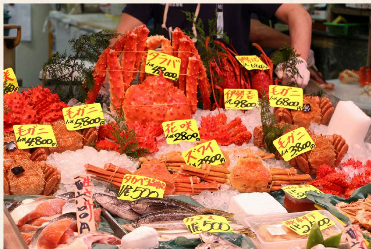
ตลาดปลาซึกิจิ