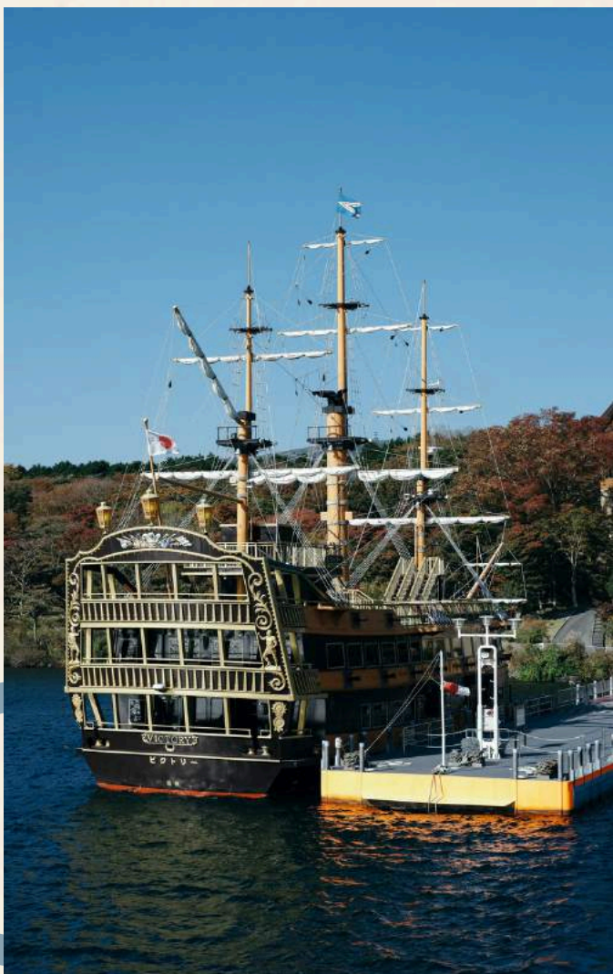
ล่องเรือทะเลสาบอาชิ

วันที่ 1 : สนามบินนาริตะ - ล่องเรือทะเลสาบอาชิ - โอวาคุดานิ - โทเทมบะเอาต์เล็ต - คาวากุชิโกะ