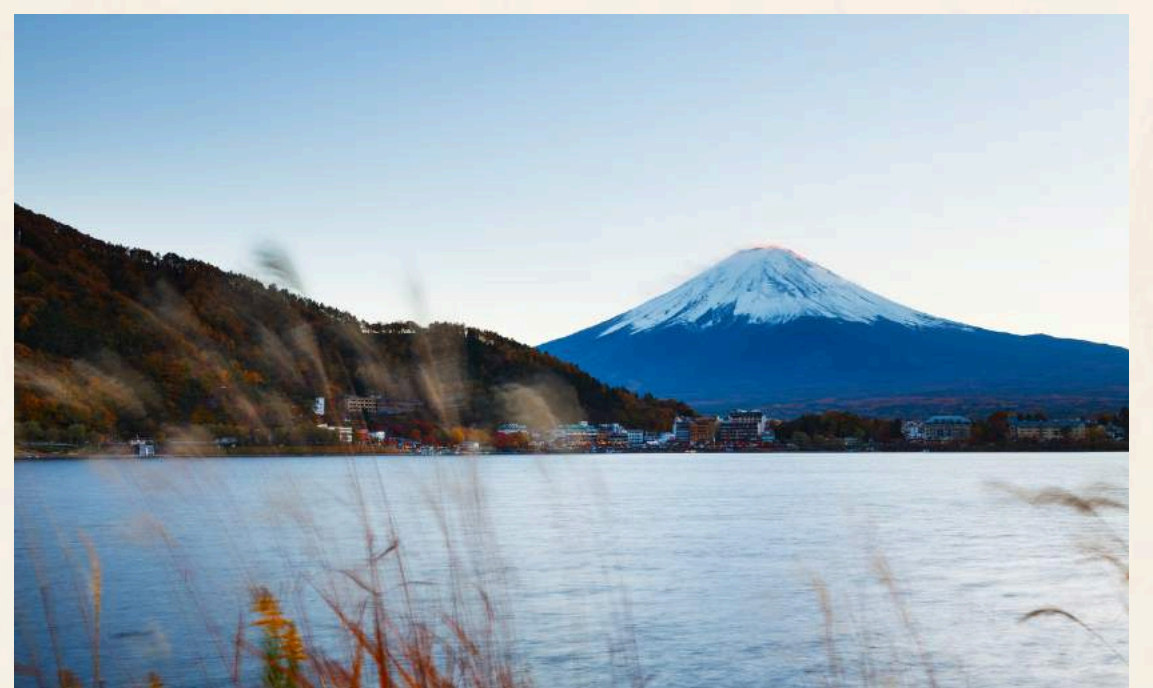
คาวากุชิโกะ