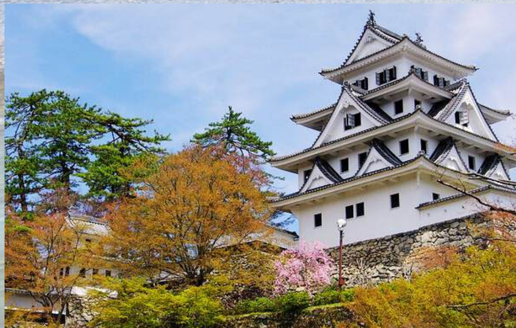
ปราสาทกุโจฮาจิมัง