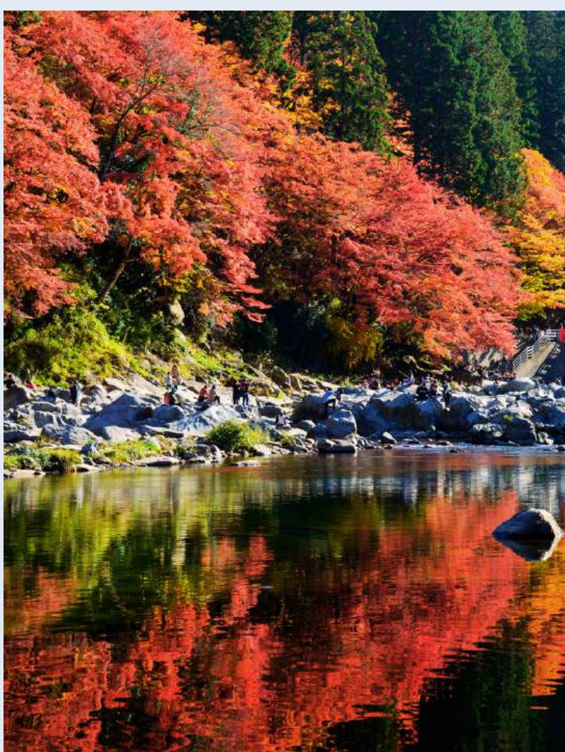
นาบานะ โนะ ซาโตะ