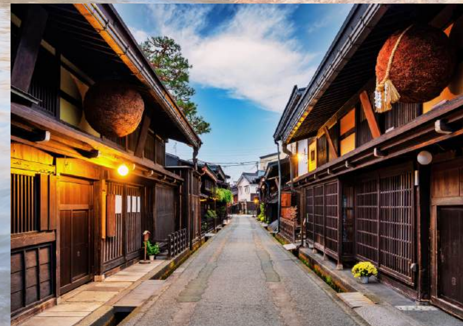
ย่านเมืองเก่าทาคายาม่า