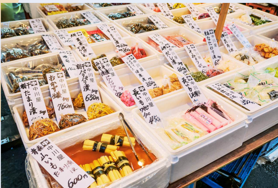
ตลาดปลาซึทิจิ