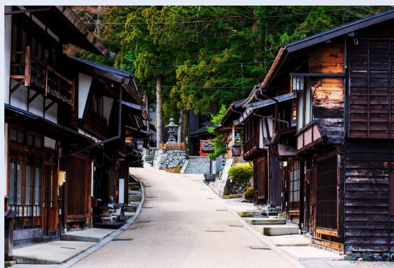
นารายจุกุ