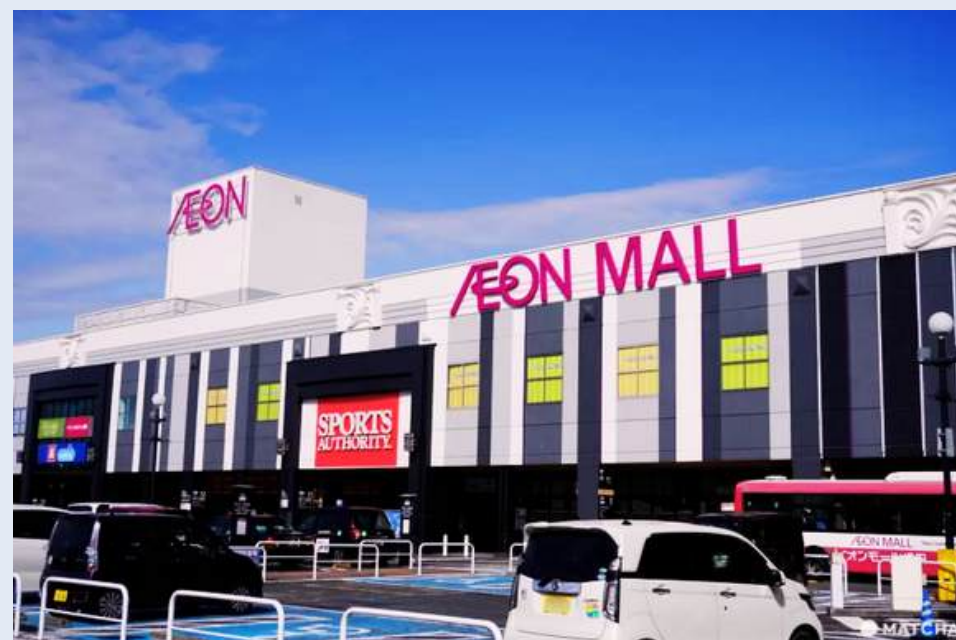
อีออนมอลล์นาริตะ