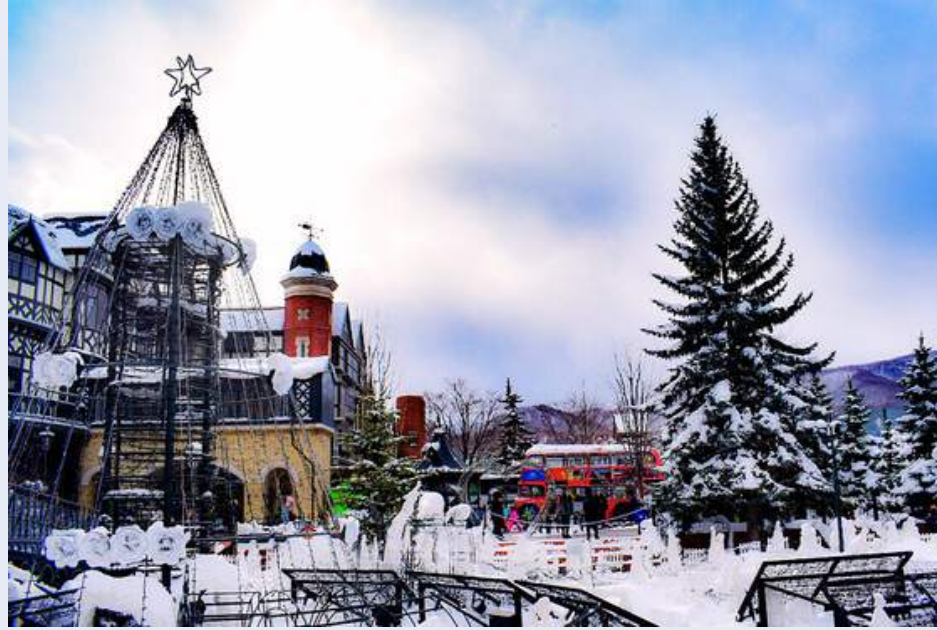
โรงงานช็อกโกแลต ชิโรอิ โคอิบิโตะ