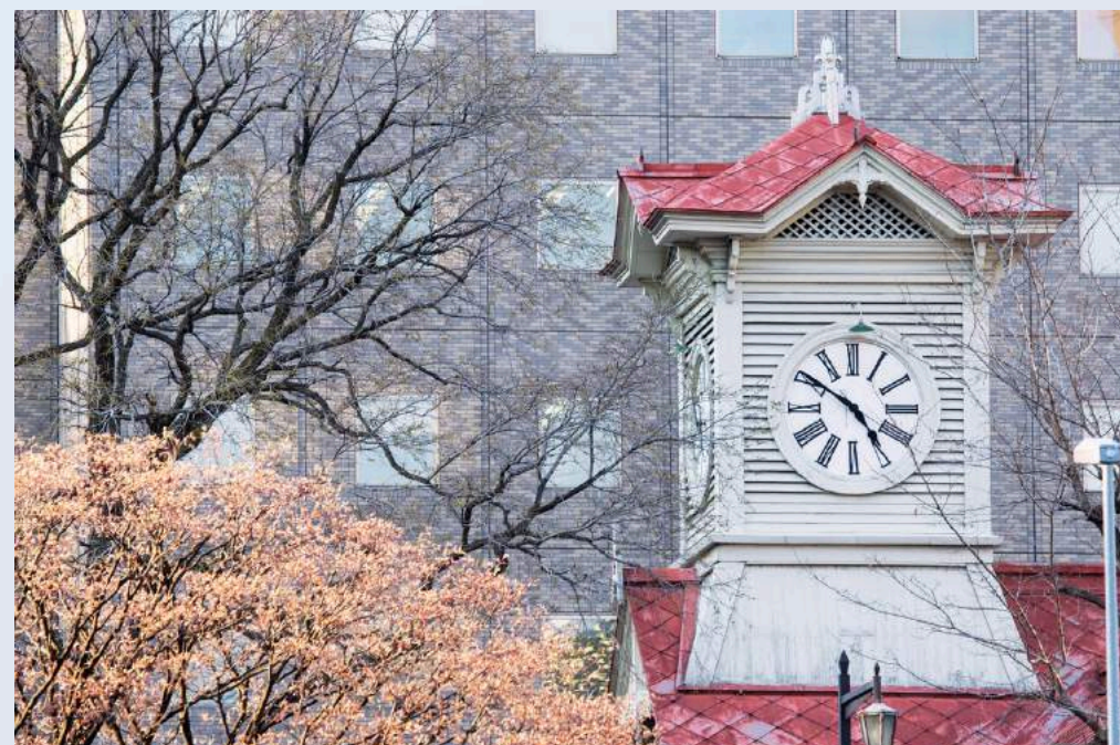
หอนาฬิกาซัปโปโร