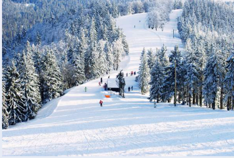
ลานสกี Rusutsu Ski Resort