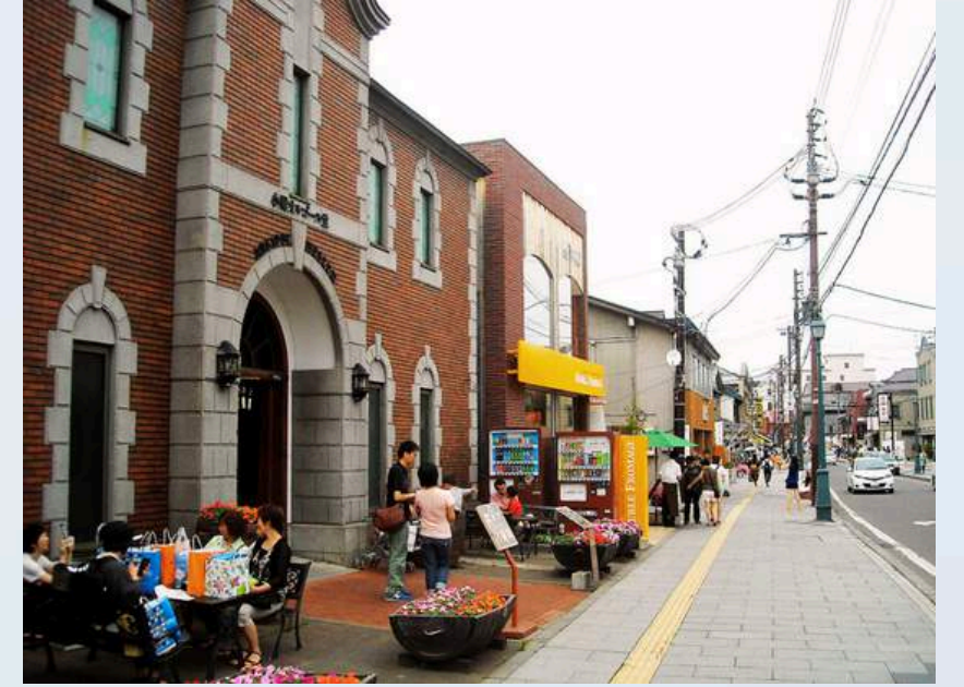
ถนนซาโงมาจิ

วันที่ 6 : อาคารที่ทำการรัฐบาลเก่า - หอนาฬิกาซัปโปโร - อิสระช้อปปิ้งสถานีรถไฟซอกโกโดและย่าน ทานุกิโคจิ