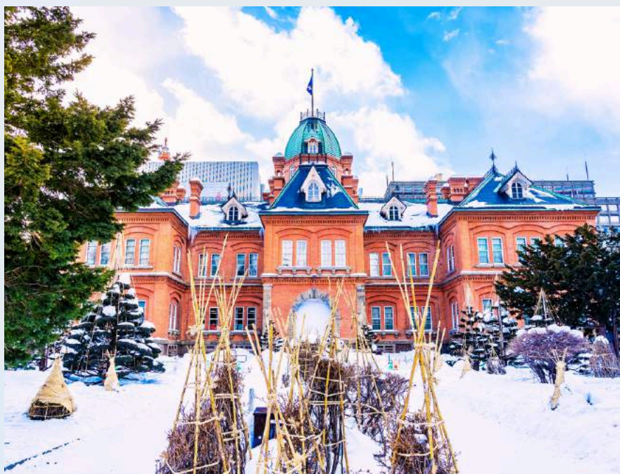
อาคารที่ทำการรัฐบาลเก่า

วันที่ 6 : อาคารที่ทำการรัฐบาลเก่า - หอนาฬิกาซัปโปโร - อิสระช้อปปิ้งสถานีรถไฟซอกโกโดและย่าน ทานุกิโคจิ