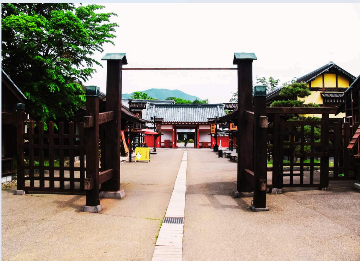
หมู่บ้านนินจาตาเตะจิโตมูระ

วันที่ 1 : สนามบินนิวยอร์ก - โนโบริเบทส์ - หมู่บ้านนินจาตาเตะจิโตมูระ - โทยะ