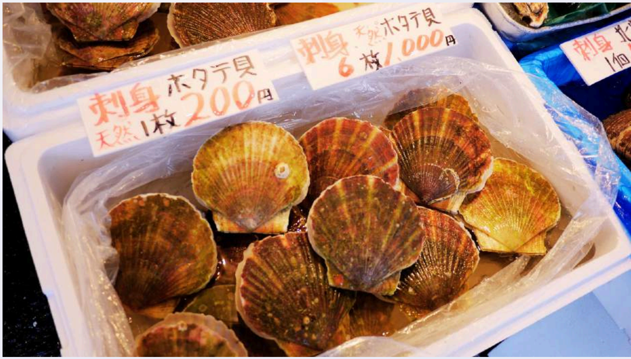
ตลาดปลาโนโงะ