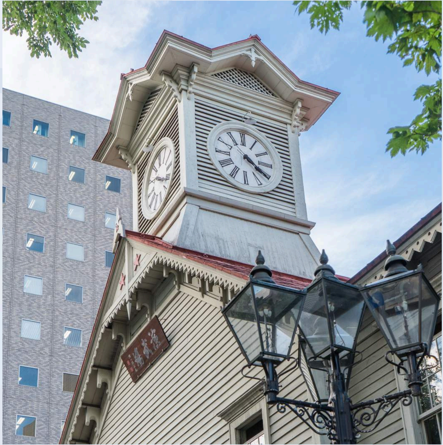
หอนาฬิกาซัปโปโร

วันที่ 5 : ตลาดปลาโนโงะ - ที่ทำการรัฐบาลเก่า - หอนาฬิกาซัปโปโร - อีระซ็อบปิ้งสถานีนรถไฟ ฮอกไกโด - ทานุกิโจจิ