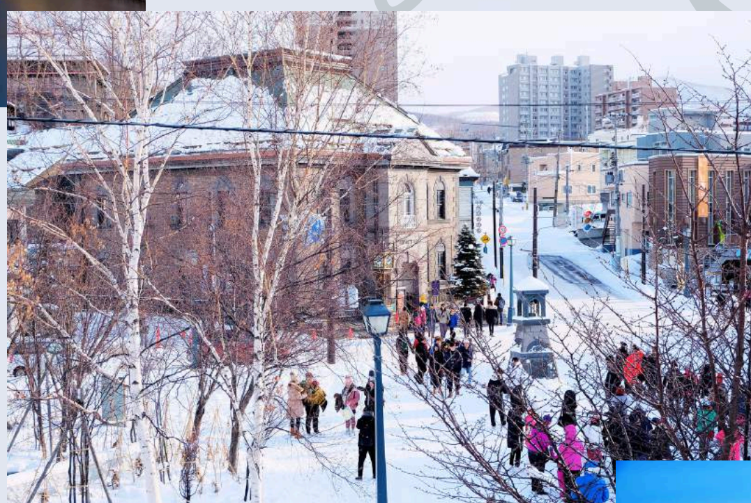
ถนนซาโคมะจิ