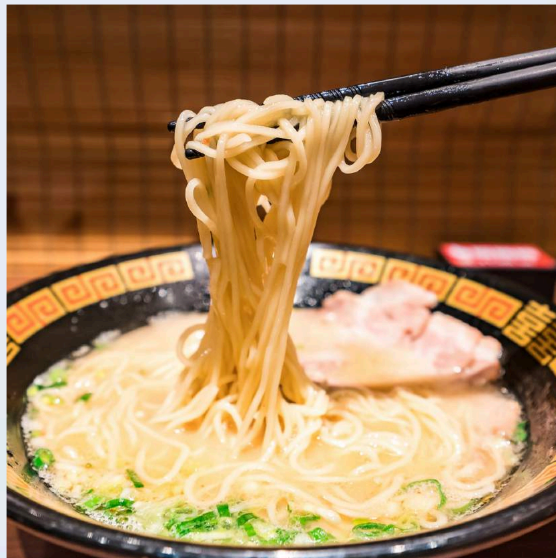
หมู่บ้านราเมง