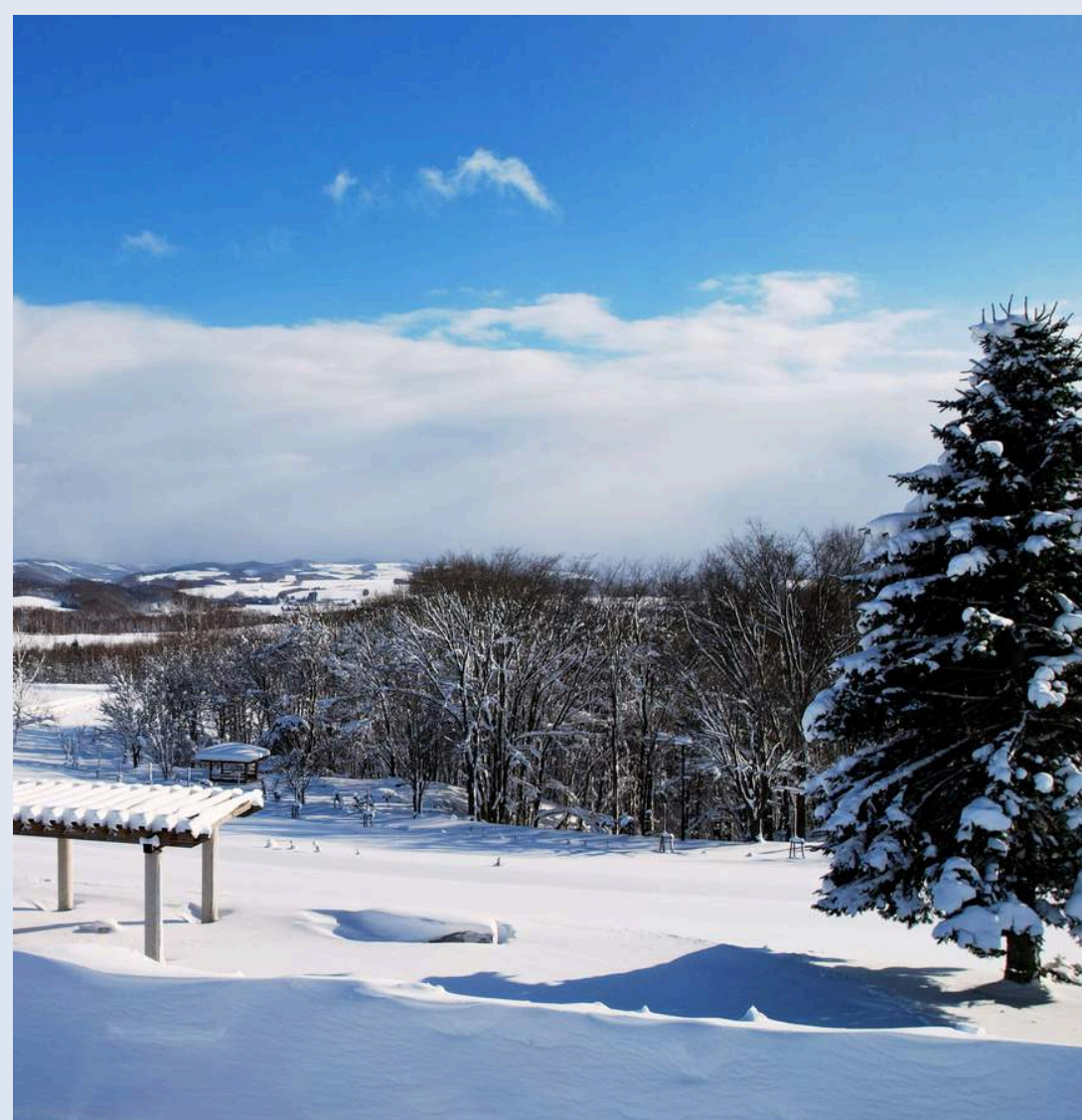
ลานสกีฟูราโน่