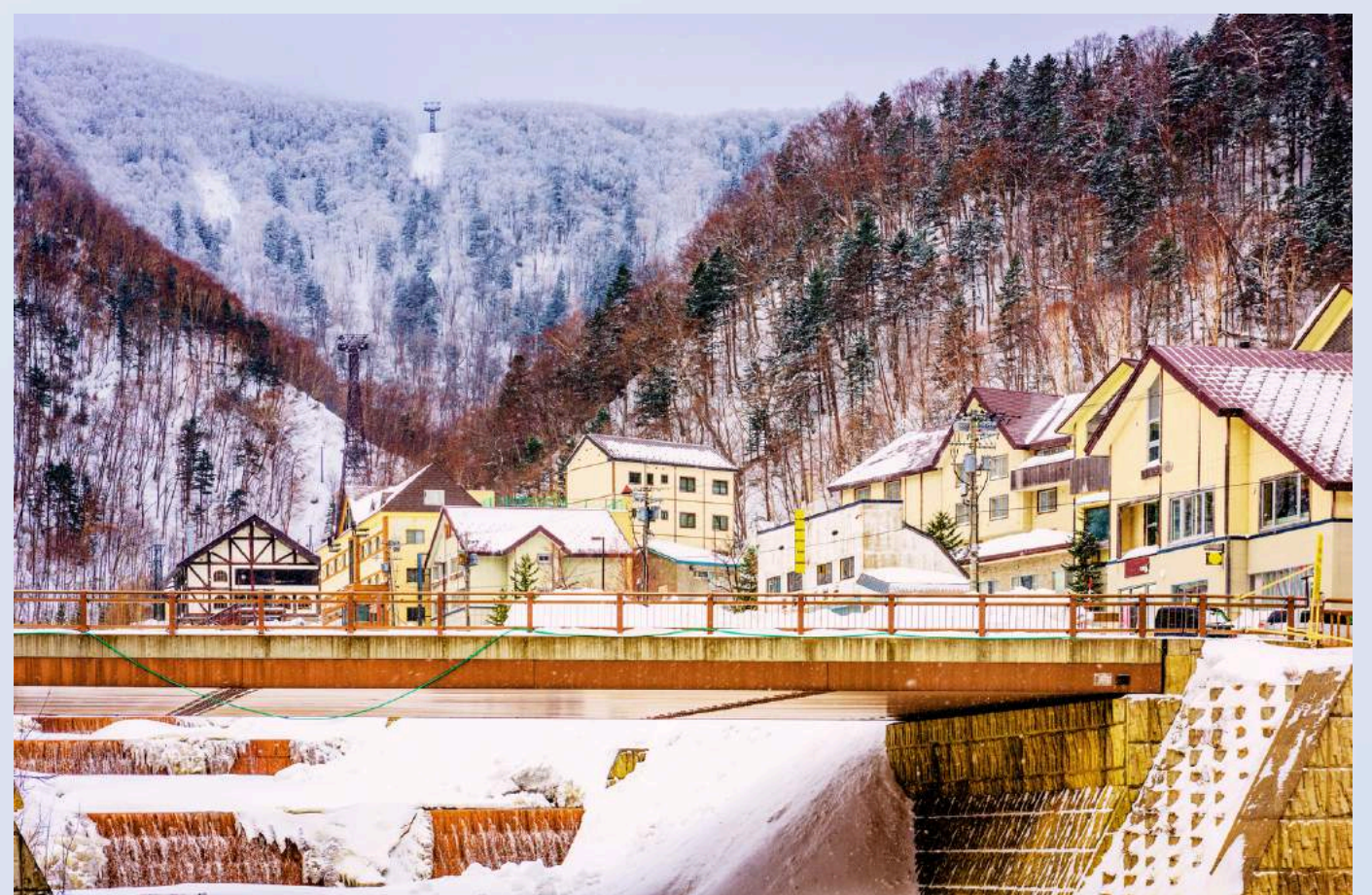
โซอุนเคียว