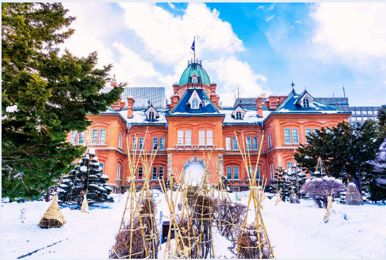
ที่ทำการรัฐบาลเก่า