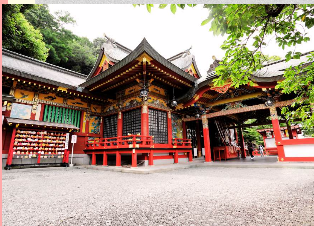
ศาลเจ้า ยูโทคุ อินาริ

วันที่ 1 : สนามบินฟุกุโอกะ - ซากะ - ศาลเจ้ายูโทคุ อินาริ (กลกิโมโน) - นางาซากิ - Huis Ten Bosch ธีมปาร์คที่ใหญ่ที่สุดในญี่ปุ่น