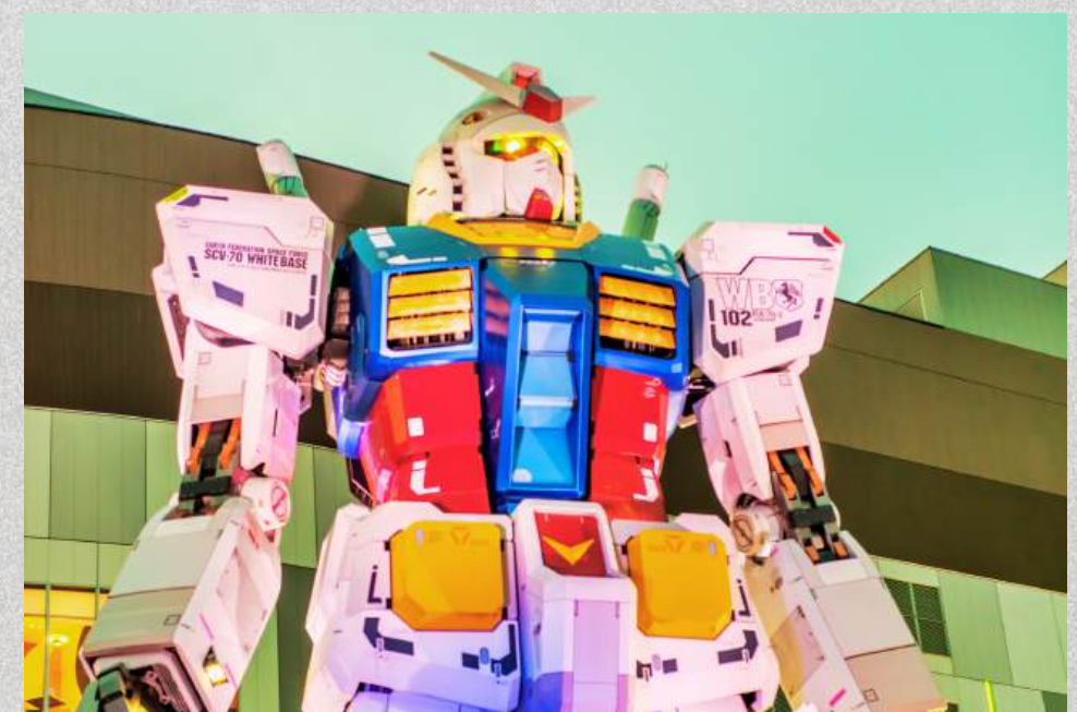
หุ่นกันดั้มยักษ์ ห้าง Lala Port

วันที่ 4 : สนามบินฟุกุโอะกะ - สนามบินสุวรรณภูมิ