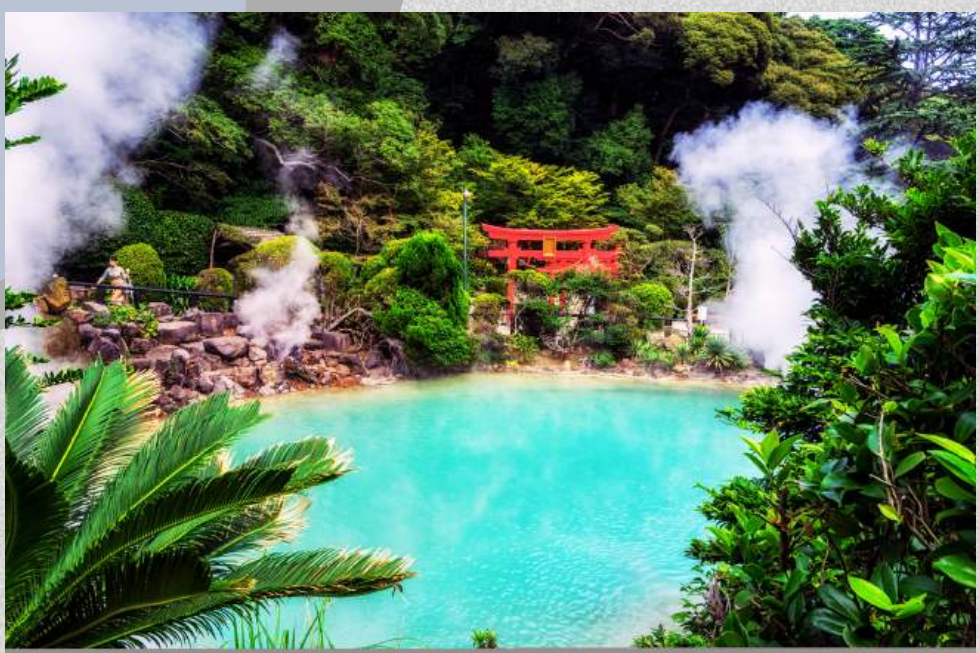
ป่อนรกจิโกกุ

วันที่ 3 : เบปปุ - ป่อนรกจิโกกุ - ฟุกุโอะกะ - วัดนันโซอิน - DUTY FREE - หุ่นกันดั้มยักษ์ตัวใหม่ล่าสุด - ช้อปปิ้งย่านเทนจิน/ฮากาตะ