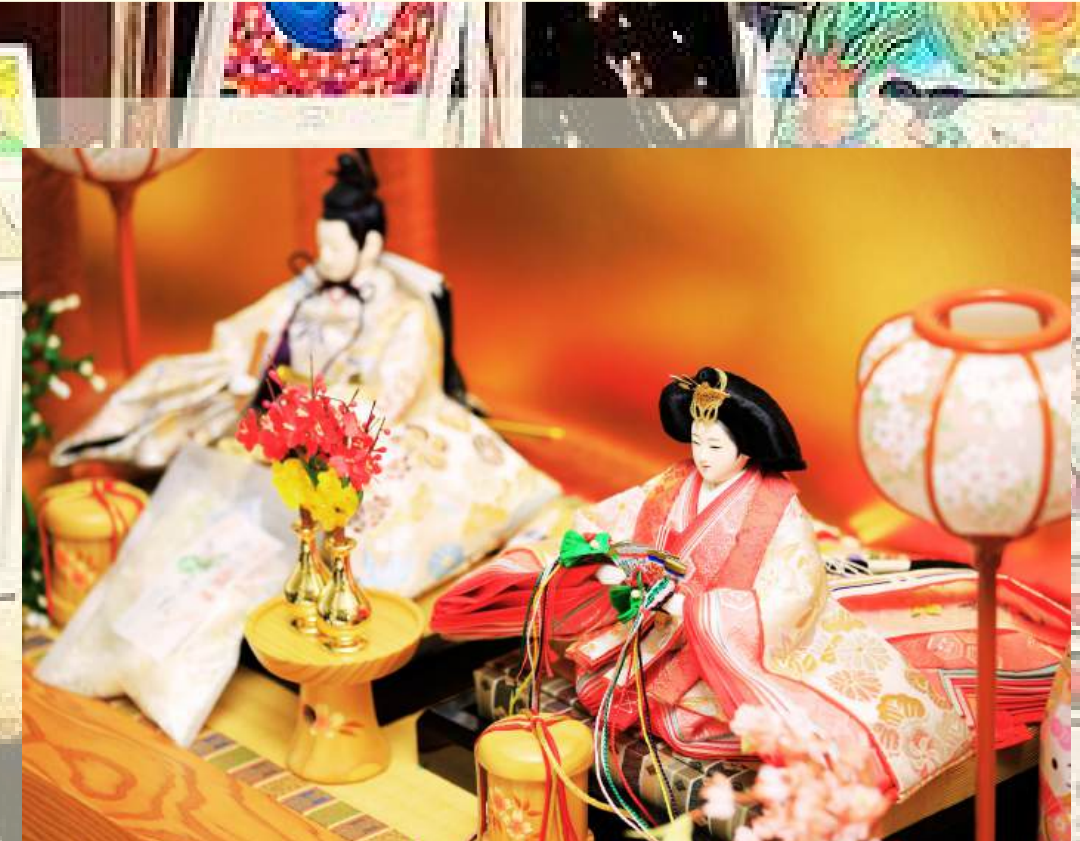
พิพิธภัณฑ์ตุ๊กตาศุ่ปุ่อินะ

วันที่ 3 : เบปปุ - ป่อนรกจิโกกุ - ฟุกุโอะกะ - วัดนันโซอิน - DUTY FREE - หุ่นกันดั้มยักษ์ตัวใหม่ล่าสุด - ช้อปปิ้งย่านเทนจิน/ฮากาตะ