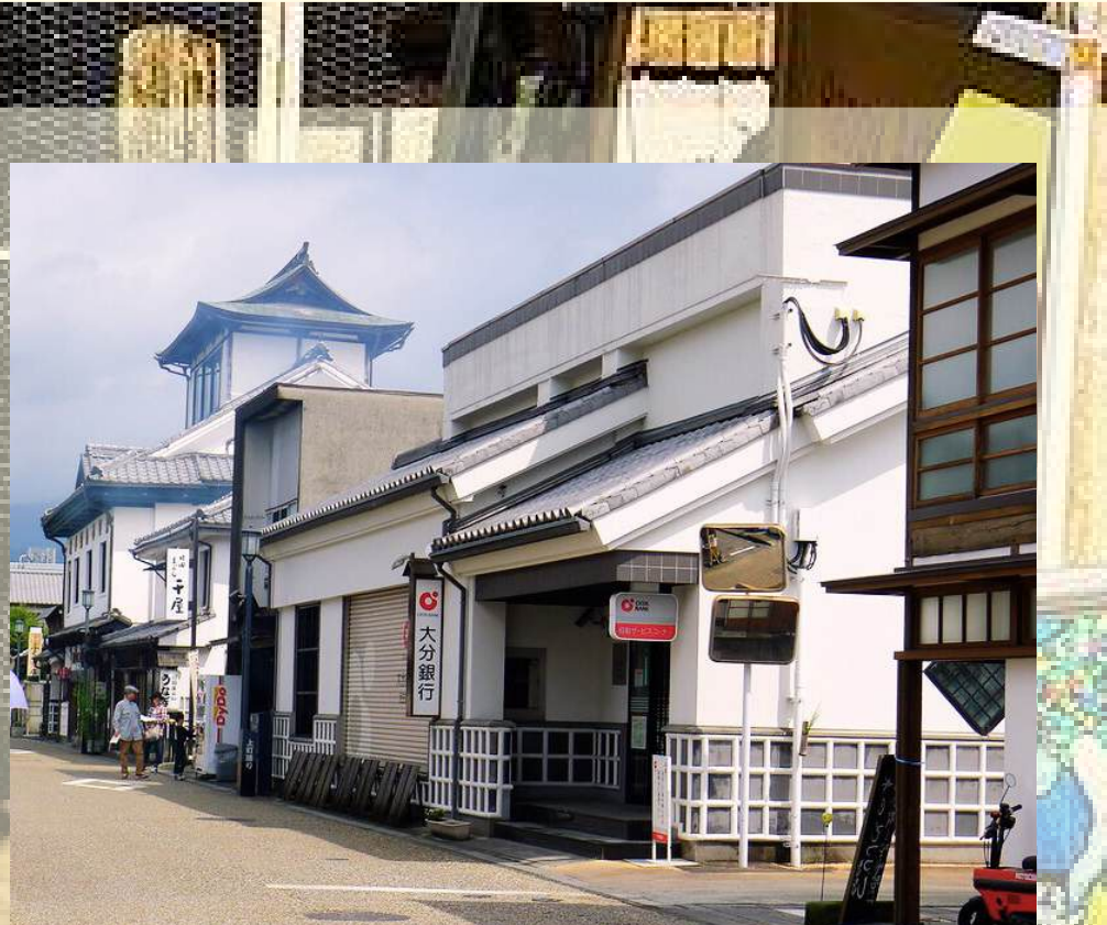
ย่านเมืองเก่ามาเมดะ มาจิ (Little Kyoto)

วันที่ 2 : นางาซากิ - Tosu Premium Outlets - ย่านเมืองเก่ามาเมดะ มาจิ (Little Kyoto) : พิพิธภัณฑ์เกียะฉุ่ปุ่ - ศาลเจ้าเกียะ - พิพิธภัณฑ์ตุ๊กตาศุ่ปุ่อินะ - ยูฟูอิน หมู่บ้านในฝัน - ทะเลสาบคินริน - เบปปุ