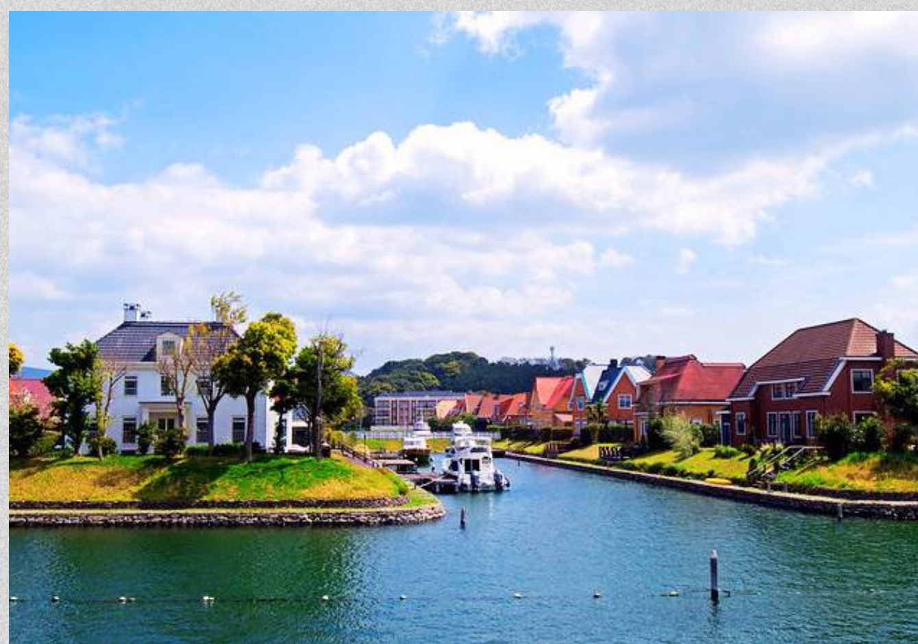
Huis Ten Bosch