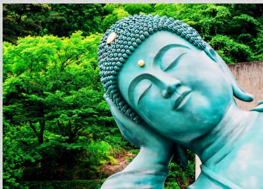
วัดนันโซอิน