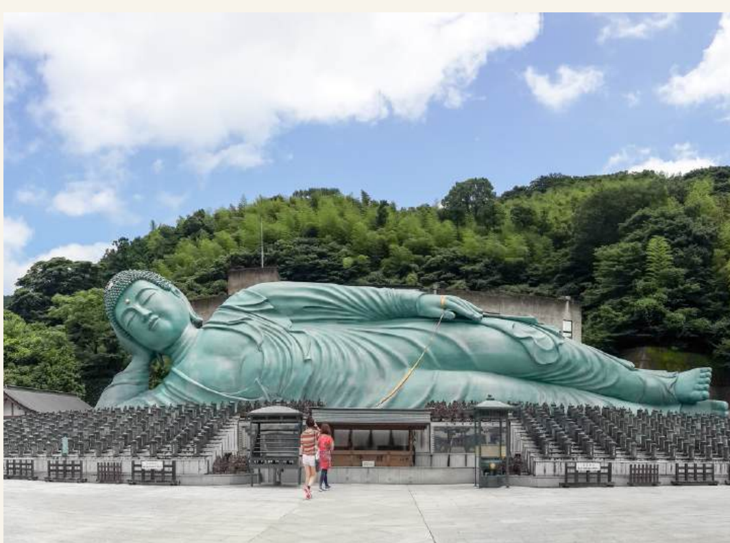
วัดนันโซอิน