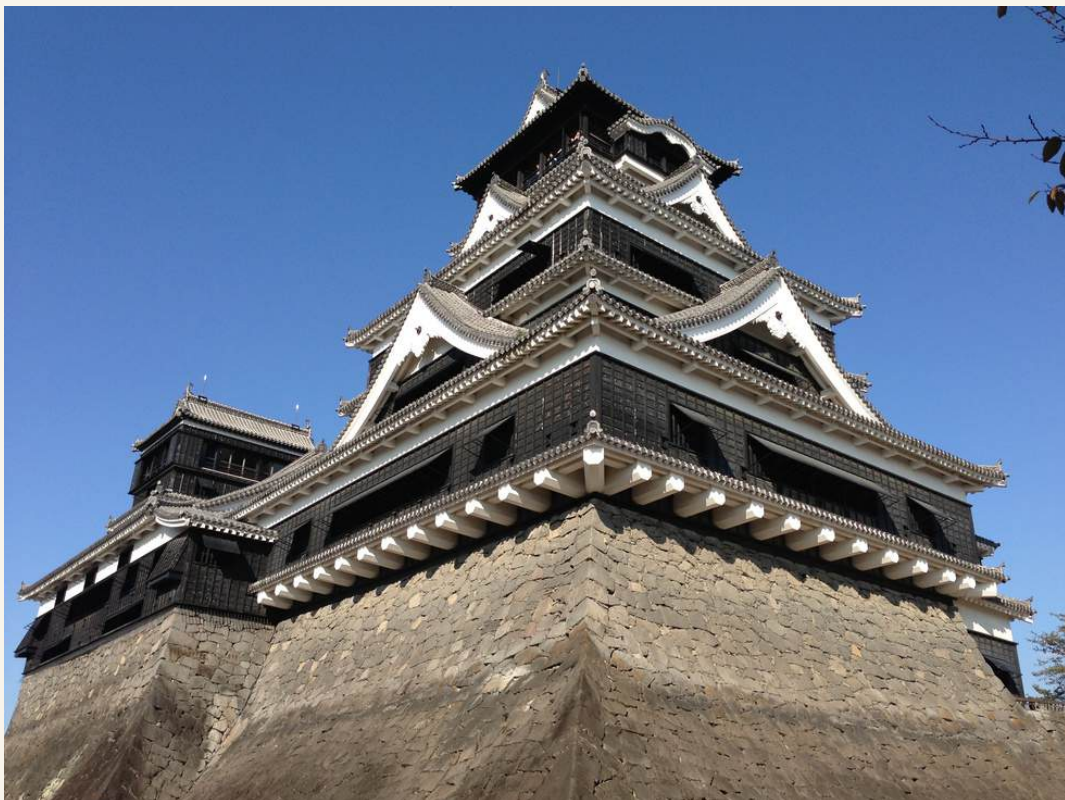
วัดนันโซอิน

วันที่ 3 : ปราสาทคุมามोट - วัดนันโซอิน - ศาลเจ้าดาไซฟู - ซุปpingย่านเทนจิน