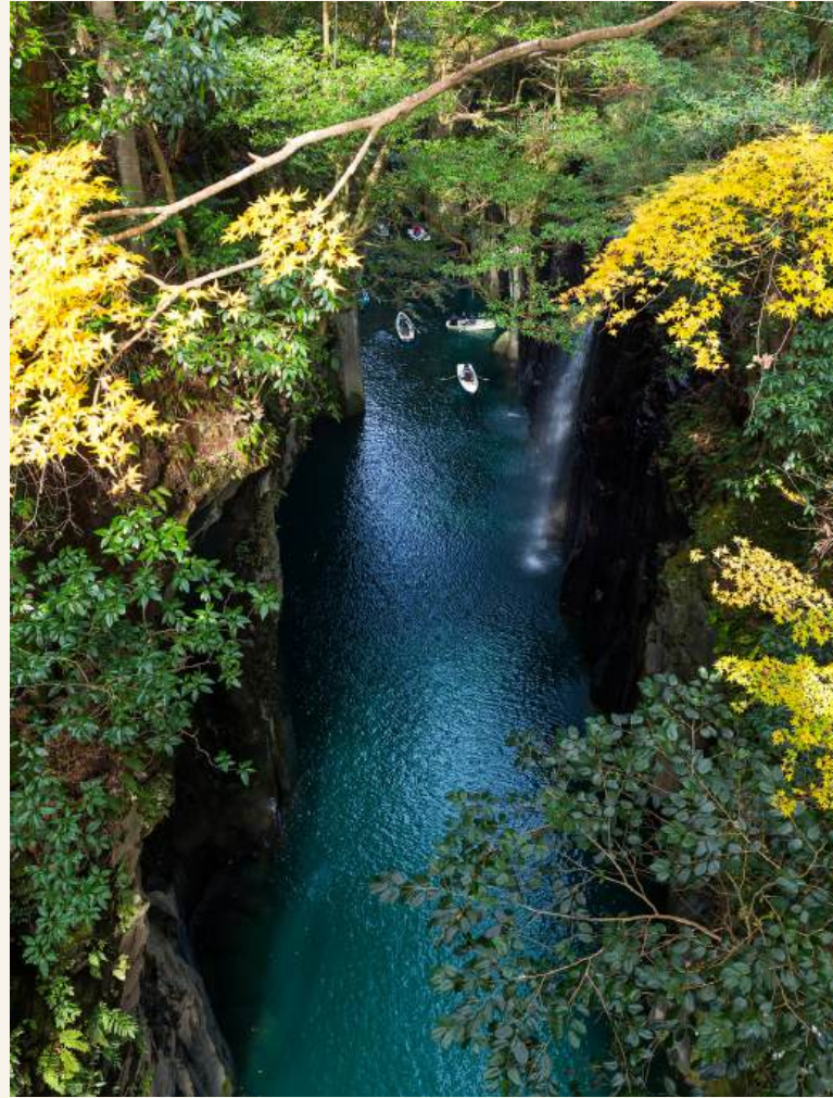
หุบเขากาคาชิโฮ