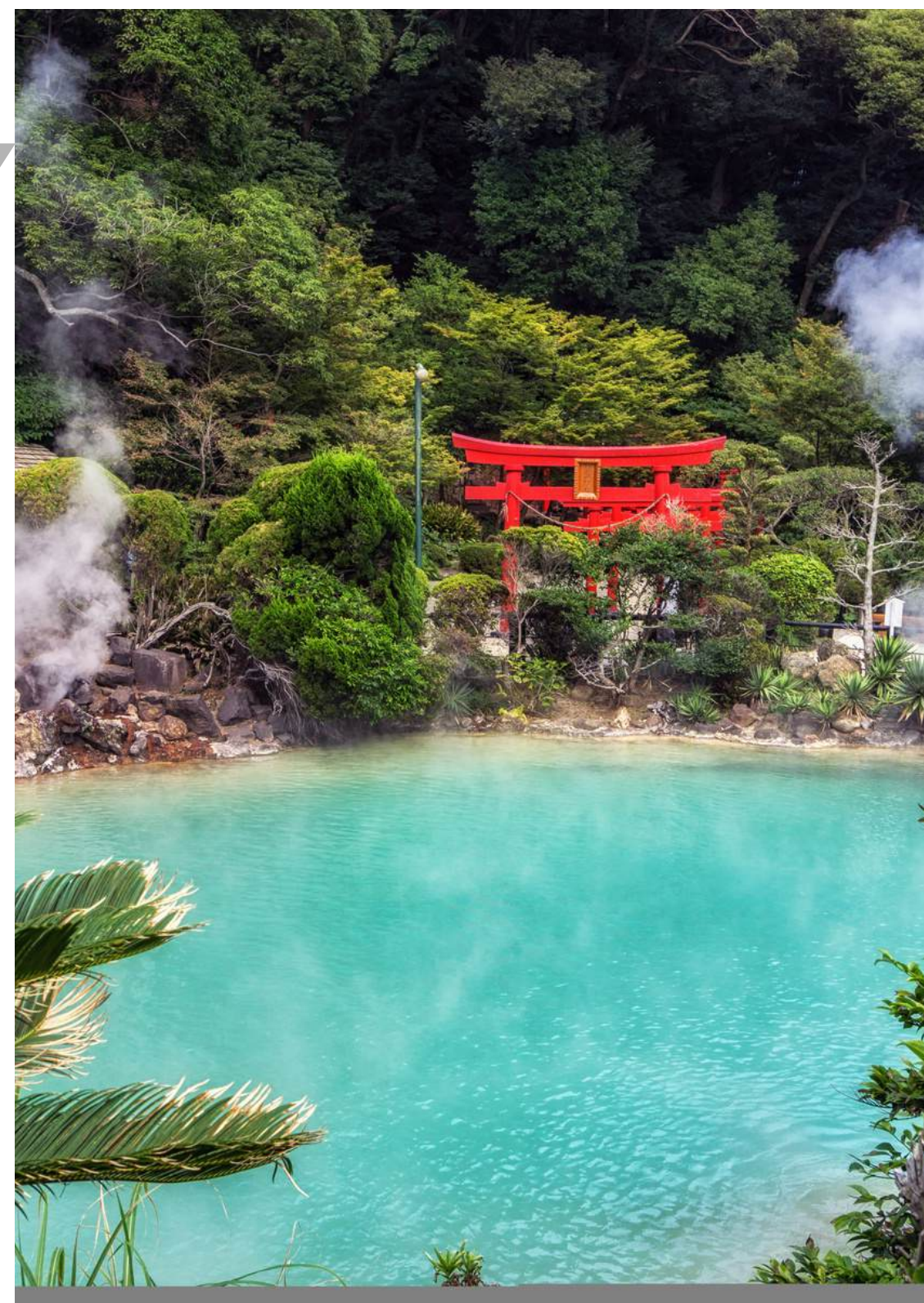
ป่อจิโกกุ