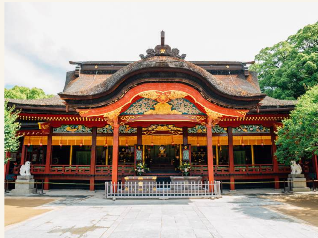
ศาลเจ้าดาไซฟู