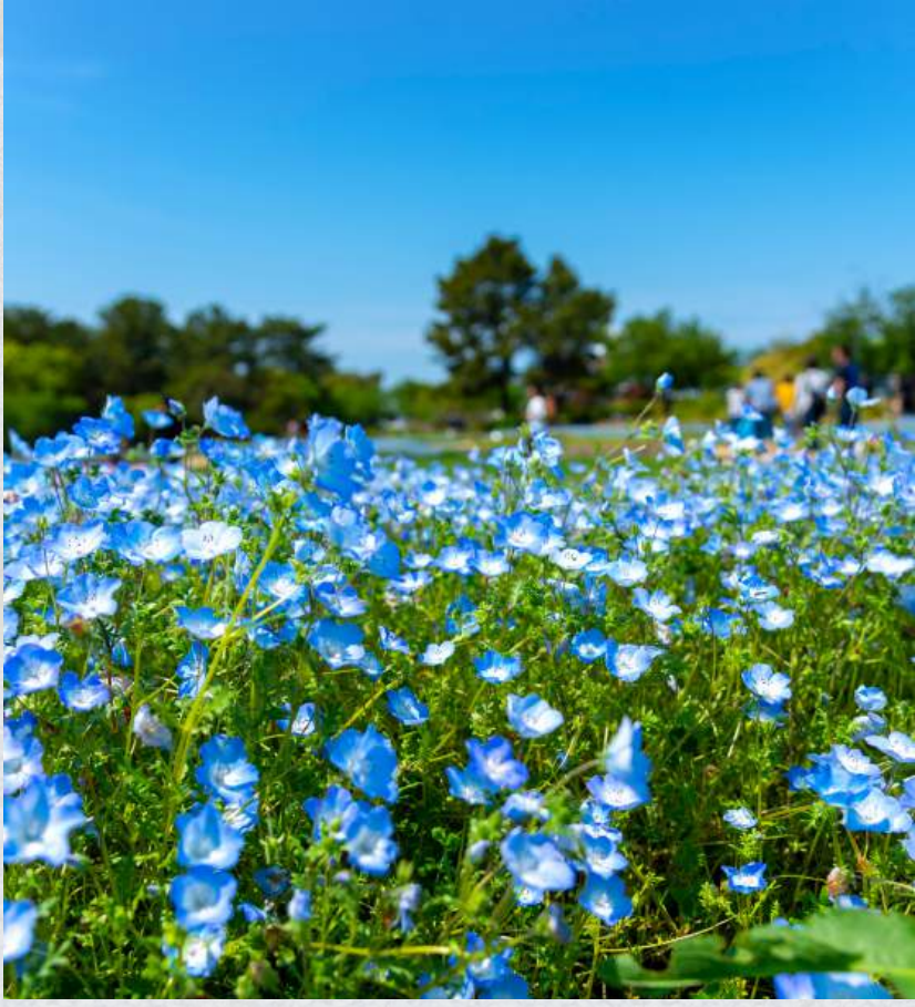
สวนริมทะเลยูมินะกะ