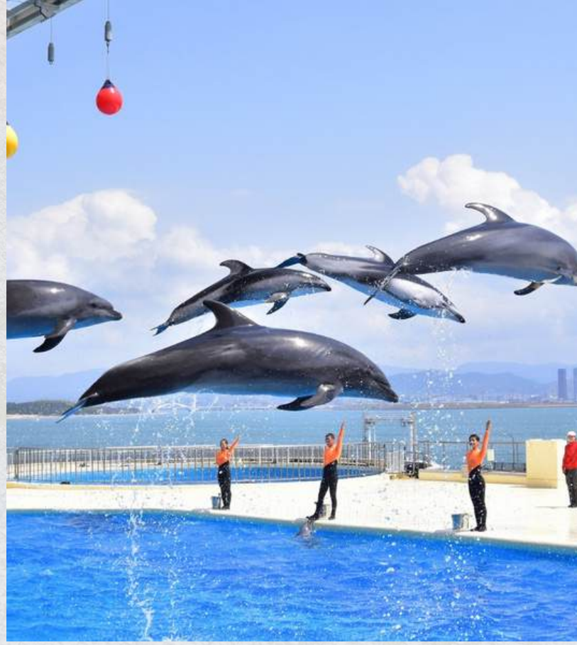
Uminonakamichi marine world