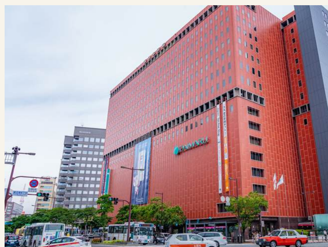
ย่านเทนจิน

Just not a journeys, but it's your memory