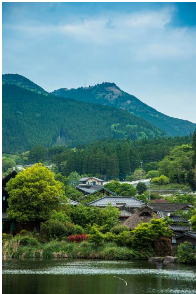
ทะเลสาบคินริน