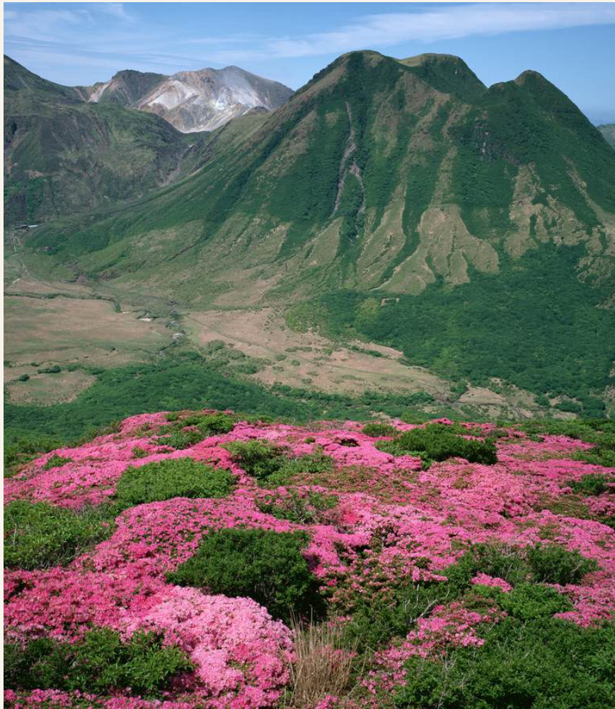
สวนดอกไม้คujukyu

วันที่ 2 : สวนดอกไม้คujukyu - หุบเขากาคาชิโฮ - ศาลเจ้าคามิชิ กิมิ คุมานะอิเมะสึ - คุมามोट