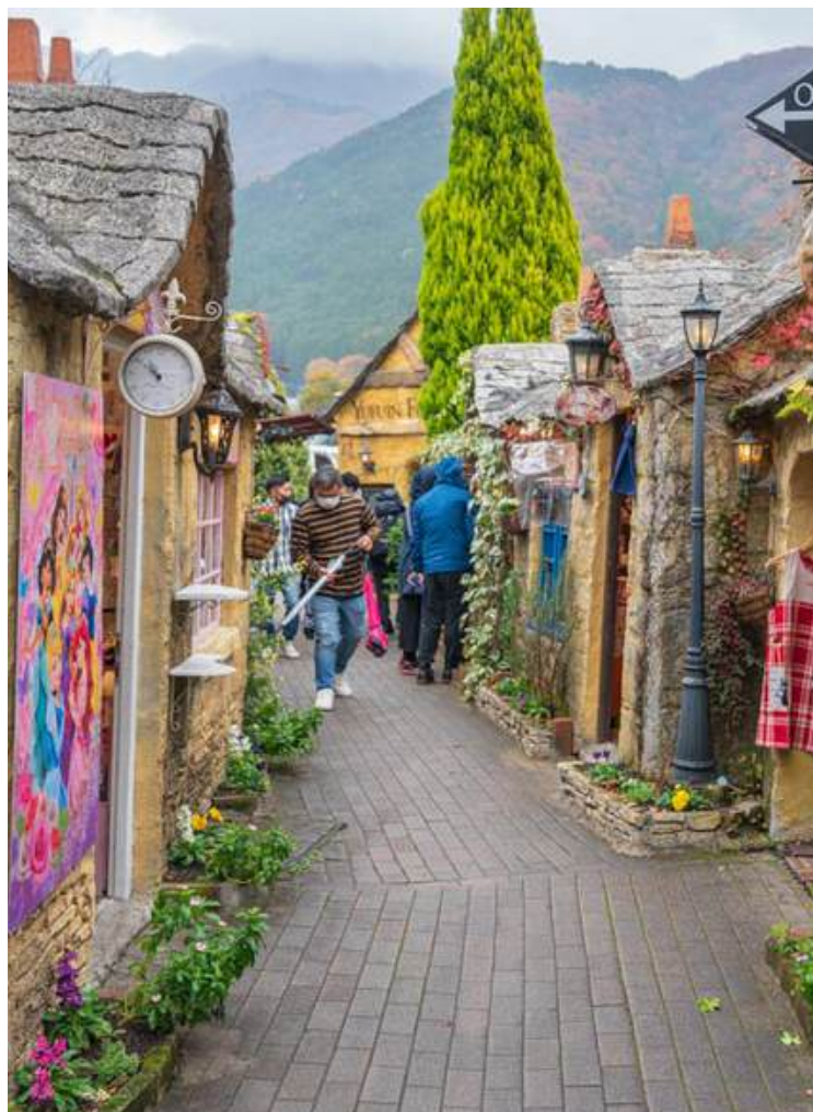
หมู่บ้านยูฟูอิน

วันที่ 1 : สนามบินฟุกุโอกะ - หมู่บ้านยูฟูอิน - ทะเลสาบคินริน - ป่อจิโกกุ