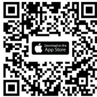
iOS iOS 14.5 ขึ้นไป