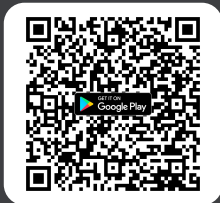
ดาวน์โหลด Application IR PLUS AGM s:UU Android Ver.8 ขึ้นไป