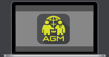
การใช้งานบน Web App "webagm.irplus.in.th"