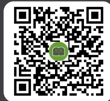
คู่มือผู้ใช้งาน s:UU IR PLUS AGM TH Ila: ENG