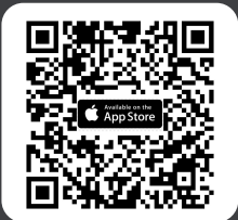
ดาวน์โหลด Application IR PLUS AGM s:UU iOS 14.5 ขึ้นไป

ในวันประชุม ผู้ถือหุ้น/ผู้รับมอบฉันทะ เข้าสู่ Application IR PLUS AGM และกรอกรหัส Pincode เพื่อลงทะเบียนเข้าร่วมประชุม