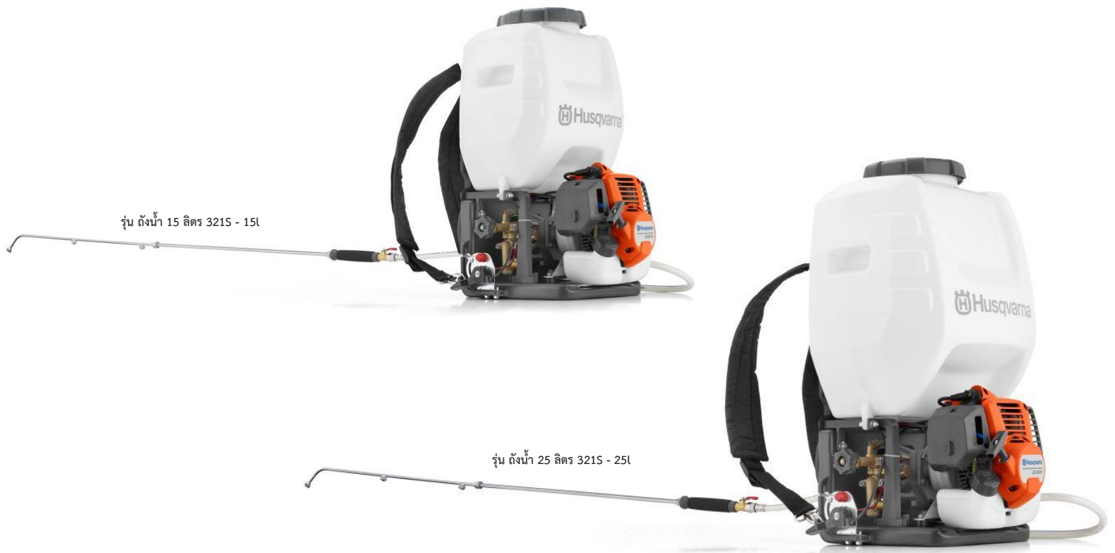
รุ่น ถังน้ำ 15 ลิตร 321S - 15L

ขอแนะนำผลิตภัณฑ์ใหม่ของฮุสวาเนา เครื่องพ่นสเปรย์รุ่น 321S25 และ 321S15 พัฒนาขึ้นด้วยการให้ความสำคัญต่อความต้องการของผู้ใช้งานเป็นหลัก มีคุณภาพสูงออกแบบมาให้ใช้งานได้อย่างดี มีความเชื่อถือได้สูง ค่าใช้จ่ายในการบำรุงรักษาต่ำและใช้งานได้ยาวนาน