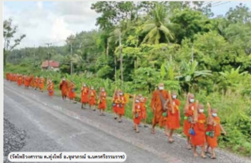
(วัดโพธิ์วงศาราม ต.ทุ่งโพธิ์ อ.จุฬาภรณ์ จ.นครศรีธรรมราช)