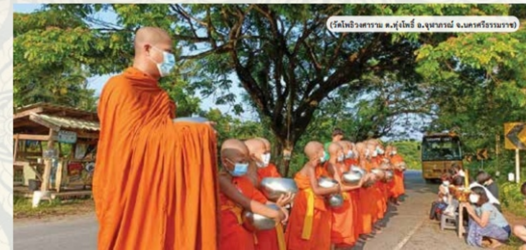
(วัดโพธิ์วงศาราม ต.ทุ่งโพธิ์ อ.จุฬาภรณ์ จ.นครศรีธรรมราช)