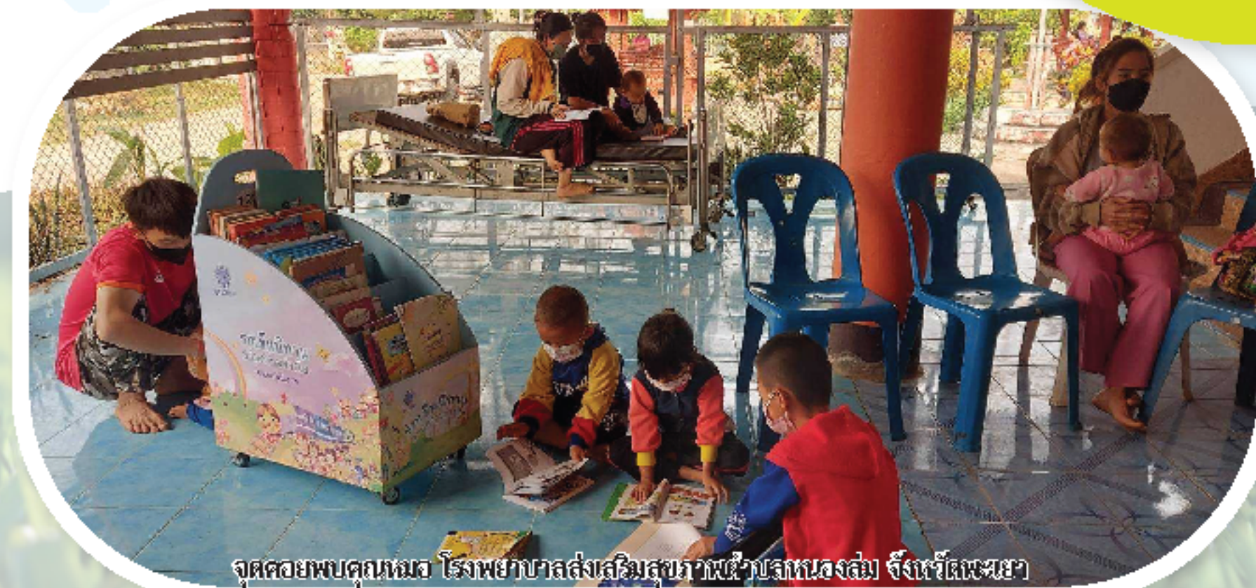
จุดคอยพบคุณหมอ โรงพยาบาลส่งเสริมสุขภาพตำบลหนองส้ม จังหวัดพะเยา

ด้วยความเคารพ โครงการรุดชนนิทาน มูลนิธิเด็ก เพื่อห่อผู้ป่วยเด็กในโรงพยาบาล