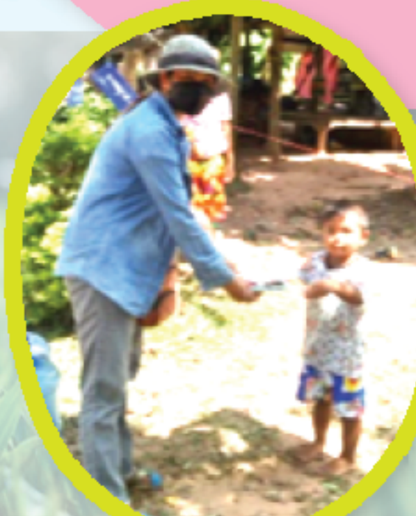
ส่งอาหารและยา พร้อมนิทานผู้ป่วยสีเขียวตามบ้าน โรงพยาบาลส่งเสริมสุขภาพตำบลทับทัน จังหวัดสุรินทร์

ค่อย ๆ เปิดกล่องเพื่อเข้าชบวนกรฆ่าเชื้อก่อนเข้าพื้นที่ ๆ จัดเป็นสถานที่ศูนย์พักคอยสำหรับผู้ป่วยสีเขียว เพื่อเฝ้าดูอาการ จ่ายยารักษาตามอาการ นอกจากอาหาร ๓ มื้อ ก็ยังมีนิทาน ๓ มื้ออีกด้วย คนไหนที่อาการไม่หนักจะพากันมาเลือกหนังสืออ่านคั่นเวลา นอกจากนอนรอคุณหมอมาสอบถามอาการอย่างเดียว หนังสือเล่มเล็กสร้างรอยยิ้มที่สดใส