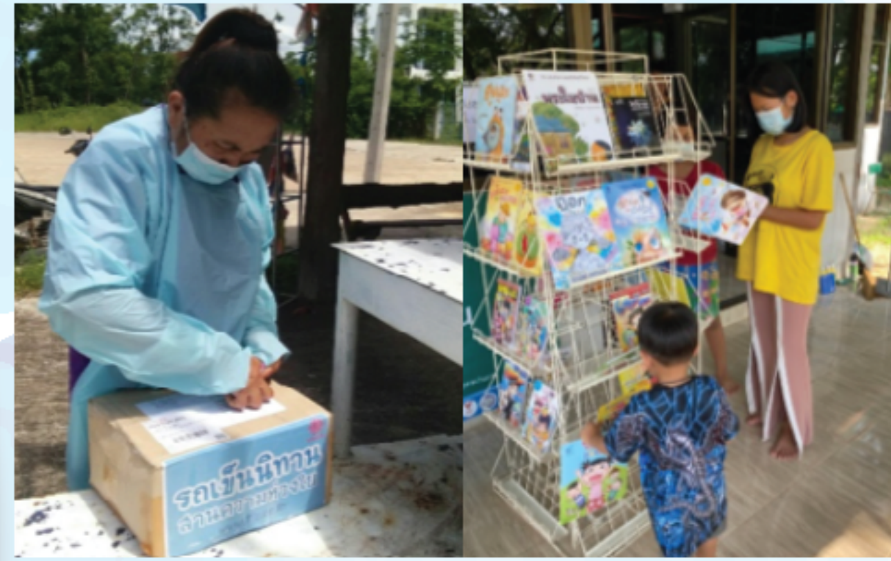
ศูนย์พักคอยผู้ป่วยติดเชื้อโควิด-19 นำหนังสือเป็นจุดรวมพลผู้ป่วยสีเขียว โรงพยาบาลส่งเสริมสุขภาพตำบลหนองยาง จังหวัดพะเยา

ค่อย ๆ เปิดกล่องเพื่อเข้าชบวนกรฆ่าเชื้อก่อนเข้าพื้นที่ ๆ จัดเป็นสถานที่ศูนย์พักคอยสำหรับผู้ป่วยสีเขียว เพื่อเฝ้าดูอาการ จ่ายยารักษาตามอาการ นอกจากอาหาร ๓ มื้อ ก็ยังมีนิทาน ๓ มื้ออีกด้วย คนไหนที่อาการไม่หนักจะพากันมาเลือกหนังสืออ่านคั่นเวลา นอกจากนอนรอคุณหมอมาสอบถามอาการอย่างเดียว หนังสือเล่มเล็กสร้างรอยยิ้มที่สดใส