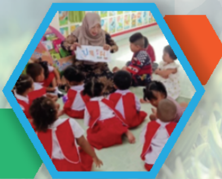
ศูนย์พัฒนาเด็กเล็กบ้านมายอ อำเภอฮารโต จังหวัดยะลา

เด็ก ๆ ได้ประโยชน์ คุณครูก็ดีใจมาก (ก.ส่วนตัว) เด็กตื่นเต้นกับของขวัญชิ้นใหญ่ที่ได้รับจากผู้ใหญ่ใจดี ศูนย์พัฒนาเด็กในพื้นที่จังหวัดยะลา มีรุดชนนิทานจำนวน ๑๑ คัน ๖ อำเภอ ๖ ตำบล (อำเภอเมืองยะลา เบตง บันนังสตา ฮารโต รามัน และกรงปินัง)