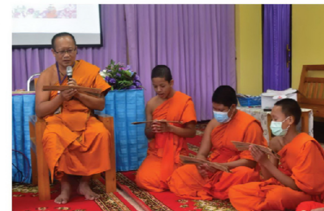
ฝึกเทศน์ธรรมชาคค โรงเรียนพระปริยัติธรรมวัดนิโครธาราม ต.ป่าคา อ.ท่าวังผา จ.น่าน

สามเณรจะรำเรียนกับพระภิกษุผู้ประเสริฐในทางปฏิบัติ ผู้เป็นกัลยาณมิตรและเป็นแรงบันดาลใจให้สามเณรในระหว่างเรียน กิจกรรมทุกกิจกรรมเป็นเรื่องการทำงานเพื่อการปฏิบัติธรรม อันเป็นคติคิดจากวัฒนธรรมตะวันออก