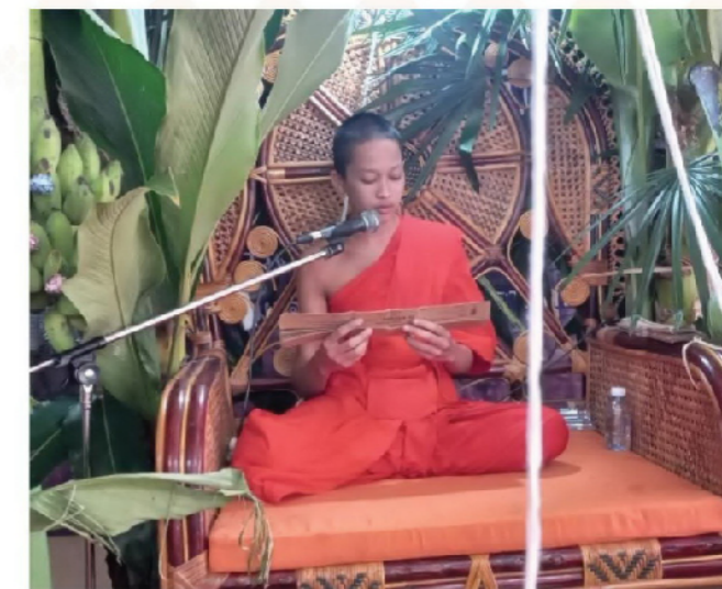
เทศน์มหาชาติ