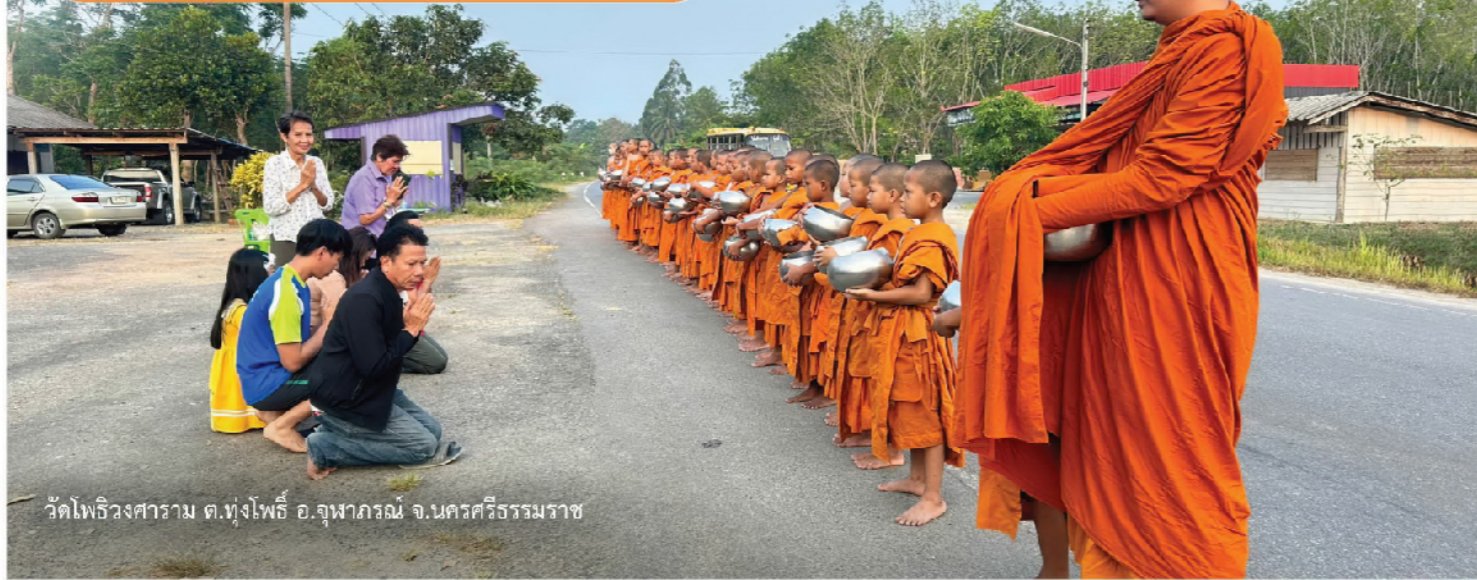
วัดไพธวงศาaram ต.ทุ่งโพธิ์ อ.จุฬาภรณ์ จ.นครศรีธรรมราช

การที่จะเปลี่ยนจากคนยากจนให้เป็นคนมีพอกินพอใช้ หรือเป็นคนอยู่ในระดับชนชั้นกลาง ต้องอาศัยการเรียนจากวัด เพื่อเรียนรู้ในระดับที่สูงขึ้น จึงออกมาทำงานทำ และสามเณร บางรูปบวชเรียนต่อเพื่อเรียนรู้หลักธรรมและวิชาการที่สูงขึ้น เพื่อเป็นพระภิกษุสืบอายุพระพุทธศาสนาต่อไป มูลนิธิเด็ก สร้างทางเลือกให้แก่เด็กที่ไม่มีโอกาสเหล่านี้ บางคนจะเอาไปศึกษาต่อและทำงานทำ ซึ่งการศึกษาอบรม ในวัดจะทำให้เขาเป็นคนดี