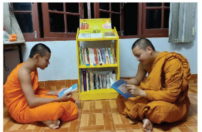
โรงเรียนพระปริยัติธรรมวัดบุญยืน ต.กลางเวียง อ.เวียงสา จ.น่าน

นับเป็นการเปลี่ยนแปลงครั้งสำคัญในชีวิตของเด็กชายที่กำลังย่างเข้าวัยรุ่น เพราะต้องออกจากครอบครัวมาใช้ชีวิตใหม่ในวัด จากความเป็นเด็กมาสู่ความเป็นสามเณรที่เกิดขึ้น ทั้งในรูปลักษณะและความประพฤติที่ต้องปรับ และเตรียมความพร้อมของเด็กสู่ชีวิตสมณเพศ เป็นชีวิตในรูปแบบใหม่นั้นคือ ชีวิตแห่งการศึกษา