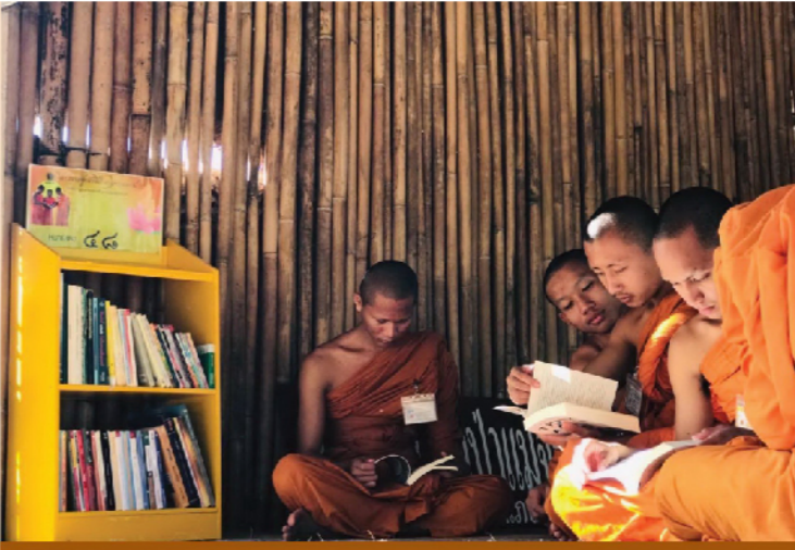
โรงเรียนวัดป่าแม่จรมโสกิตาราม ต.แม่จรม อ.แม่จรม จ.น่าน

ปี ๒๕๖๖ กำหนดการถวายตู้หนังสือในกุฏิพระและวัด ในพื้นที่ จ.นครพนม จำนวน ๕๐ ตู้ ๕๐ วัด และพื้นที่ จ.เลย/จ.เชียงใหม่ จำนวน ๕๐ ตู้ ๕๐ วัด