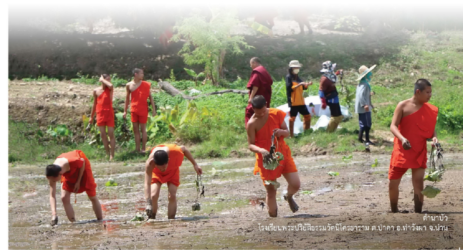
ตานาบัว โรงเรียนพระปริยัติธรรมวัดนิโครธาราม ต.ป่าคา อ.ท่าวังผา จ.น่าน