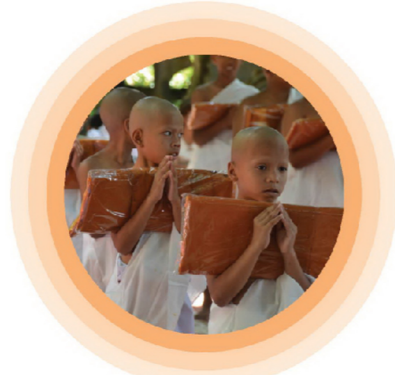
วัดไพธวงศาaram ต.ทุ่งโพธิ์ อ.จุฬาภรณ์ จ.นครศรีธรรมราช

รวมถึงการพัฒนากระบวนการศึกษาของสงฆ์ที่เอื้อประโยชน์ต่อพระพุทธศาสนาและสังคมต่อไป