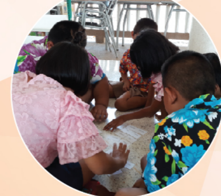
นักเรียนโรงเรียนวัดบางประจันต์ฯ จำนวน ๔๗ คน เข้าร่วมกิจกรรมส่งเสริมการอ่านและการเรียนรู้ จำนวน ๑๗ ครั้ง