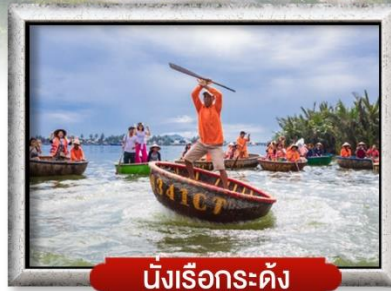
นั้งเรือกระดิง