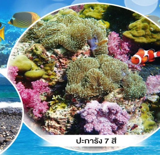
ปะการัง 7 สี