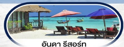
อันดา รีสอร์ท