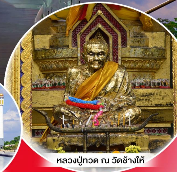
หลวงปู่ทวด ณ วัดช้างไห้