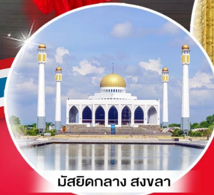
มัสยิดกลาง สงขลา