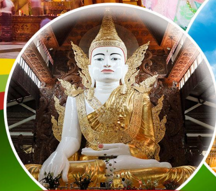
พระหงาทัดจี