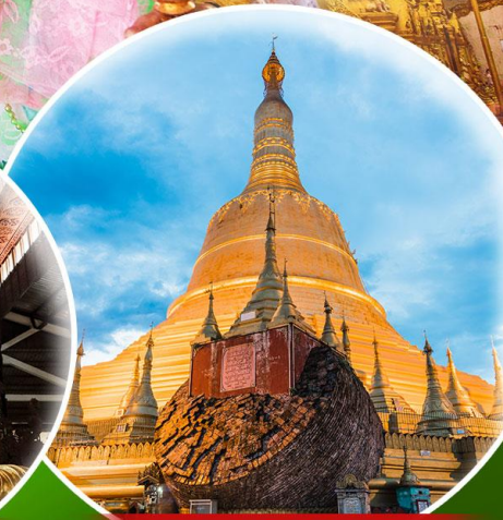
พระรัตนบุเตา