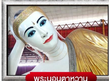
พระนอนตาหวาน