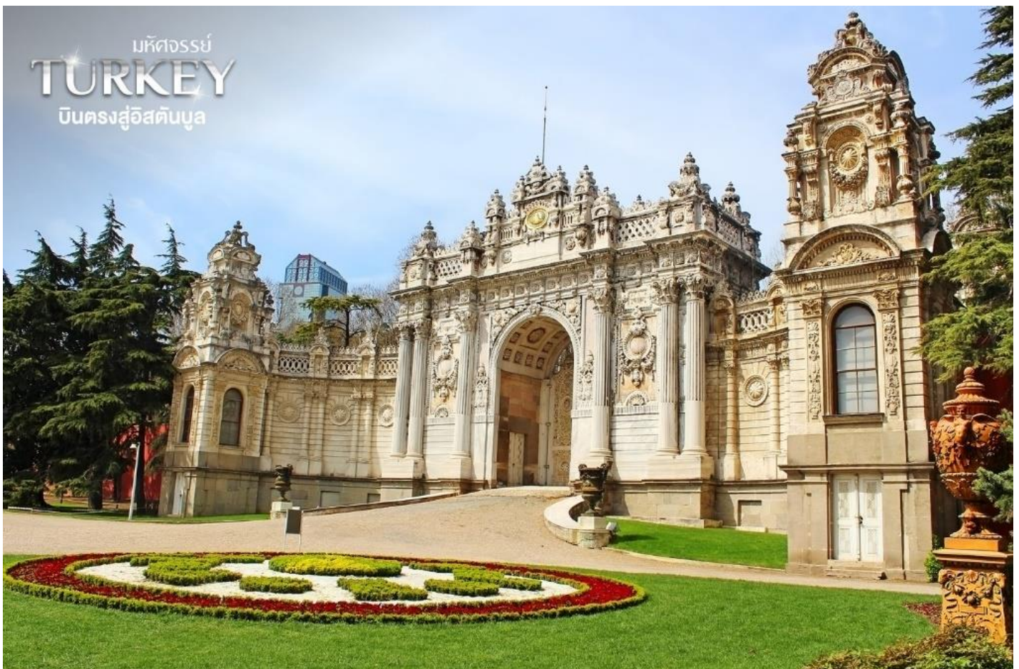
มหัศจรรย์ TURKEY บึงตรงสู่อิสตันบูล

แต่มีคนสวนชาวฮอลแลนด์นำกลับมาปลูก และเพาะพันธุ์ และผสมพันธุ์ใหม่จนเกิดเป็นหลากหลายสี และหลายพันธุ์ การผสมพันธุ์ ดอกไม้ที่ไม่เป็นไปตามธรรมชาติ นั้น จึงขัดต่อหลักศาสนา และถูกห้าม จึงทำให้หัวทิวลิปนั้นมีราคาแพง คนรวยในสังคมชั้นสูงจึงจะมีเงินซื้อมาปลูก และมีราคาแพงมากจนถูกห้ามปลูก ในอังกฤษ จากนั้นการเพาะพันธุ์ทิวลิป ได้รับการยอมรับและรัฐบาลสนับสนุน และเป็นสินค้าส่งออกที่สำคัญอย่างหนึ่งของเนเธอร์แลนด์