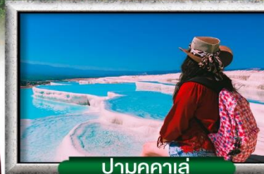
ปามุกคาเล่