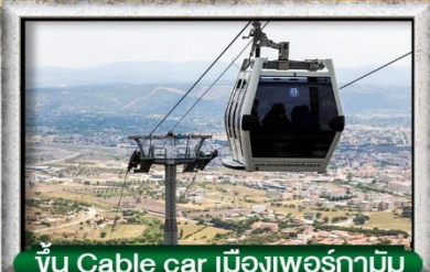
ขึ้น Cable car เมืองเพอร์غامัม