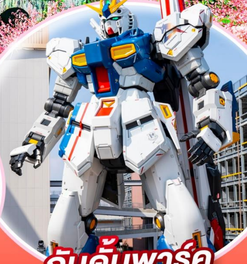
กันดั้มพาร์ค