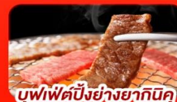
บุฟเฟ่ต์ปิ้งย่างยากินุกุ