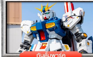
กันดั้มพาร์ค