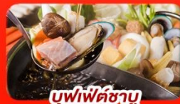
บุฟเฟ่ต์ซาบู