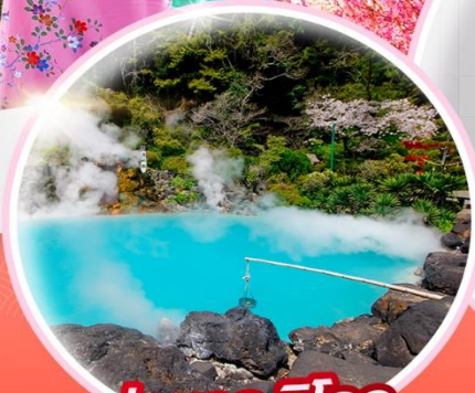
บ่อนรก จิโกกุ