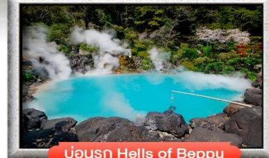
บ่อน้ำ Hells of Beppu