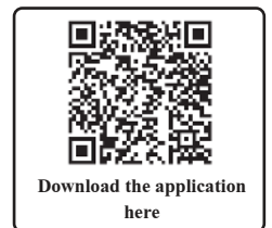
Download the application here