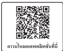
ดาวน์โหลดแอปพลิเคชันที่นี่