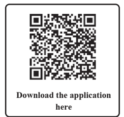
Download the application here