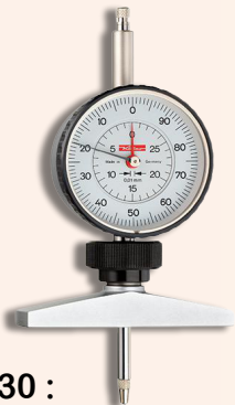
TM 2/30 :