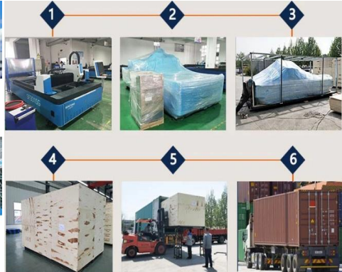
โรงงาน SENFENG LAIMING LASER สาขาต่าง ๆ ที่ สหรัฐอเมริกา,เยอรมัน,อินเดีย,ปากีสถาน