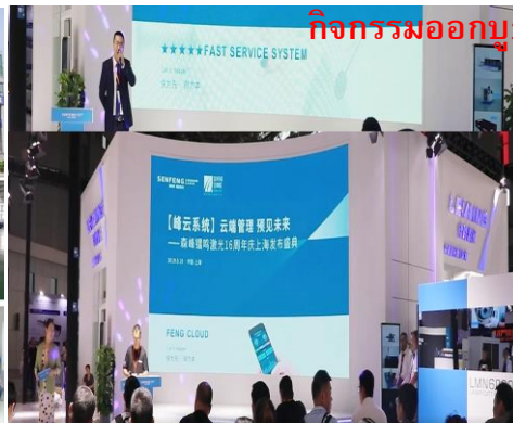
กิจกรรมออกบูธงานแสดงสินค้า