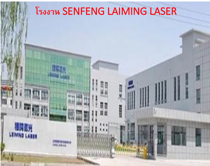
โรงงาน SENFENG LAIMING LASER

SENFENG LEIMING เลเซอร์มีอาชีพผู้ผลิตหมั่นในการวิจัย,การพัฒนา,การผลิต, ขยายบริการเลเซอร์ตัดระบบ เลเซอร์ตัดเลเซอร์ทำความสะอาดเครื่อง, เลเซอร์เครื่องหมาย,เลเซอร์เครื่องเชื่อมและ 3D หุ่นยนต์ เหล่านี้อุปกรณ์ใช้กันอย่างแพร่หลายในห้องครัวอุปกรณ์,อุปกรณ์เครื่องกล,ชิ้นส่วนรถยนต์อุปกรณ์แสดงผลและโลหะการประมวลผล SENFENG LEIMING เลเซอร์มีสี่มาตรฐานเลเซอร์อุปกรณ์การผลิตฐานรวมพื้นที่มากกว่า 120,000 เมตร. บริษัทมีพนักงานมากกว่า 950 คน,หลายชุดเต็มอัตโนมัติอุปกรณ์การผลิต, มีการผลิตที่เข้มงวดกระบวนการประจำปี OUT PUT สามารถเข้าถึง 5000 ชุดผ่าน CE จาก TUV,FDA, ISO9001 อื่นๆ International Certification ในเวลาเดียวกัน,SENFENG เลเซอร์มีก่อตั้งหลายสาขาใน เยอรมนี, สหรัฐอเมริกา, อินเดีย ที่สมบูรณ์แบบและบริการเพื่อให้ Solutions สำหรับลูกค้าทั่วโลก.