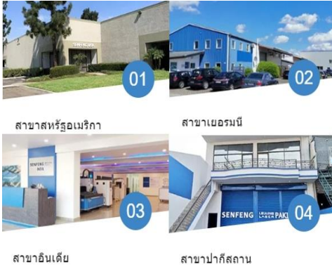
สาขาสหรัฐอเมริกา