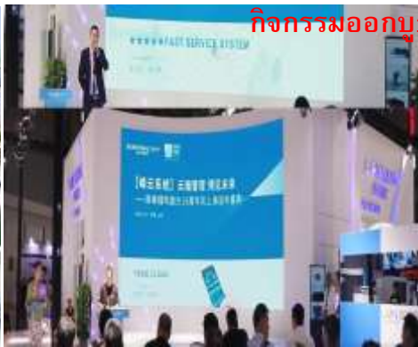
กิจกรรมออกบูธงานแสดงสินค้า