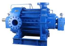
HD 150% -1min (Heavy Duty) Hoist, High-pressure pump