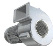
ND 120% -1min (Normal Duty) Fan, Blower, Standard Pump