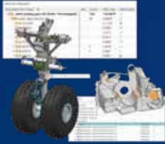
NX Modeling Fundamental