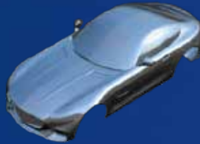
NX Free-Form Modeling