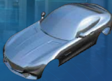
NX Free-Form Modeling