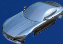
NX Free-Form Modeling