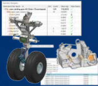
NX Modeling Fundamental