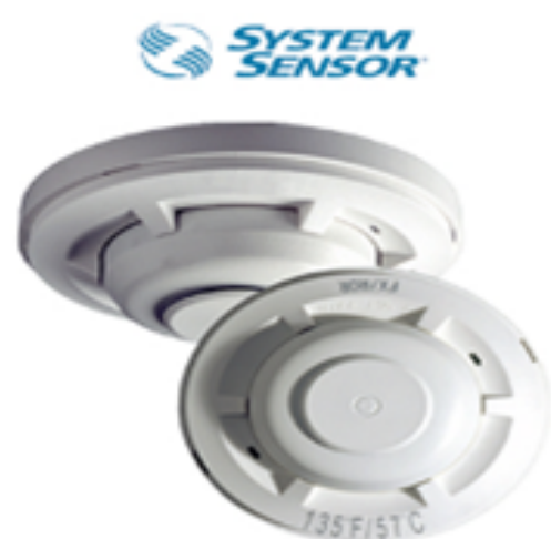
5600 Series Mechanical Heat Detectors