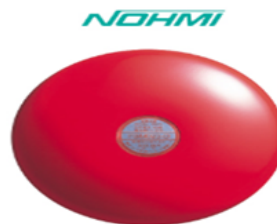
Fire Alarm Bell