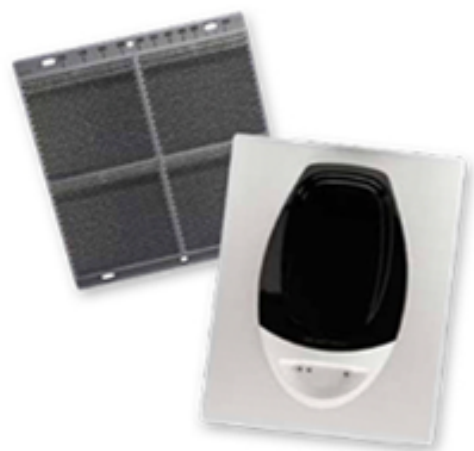
Beam Smoke Detector BEAM1224(S)