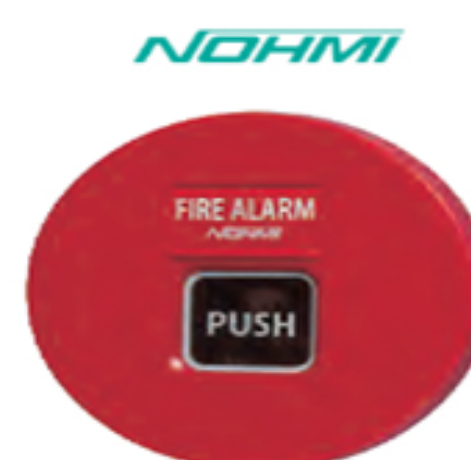
Manual Fire Alarm Box