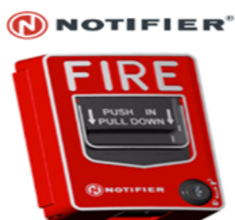
Manual Fire Alarm Pull Stations