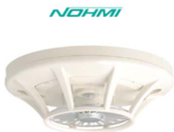
Fixed Temperature Detector