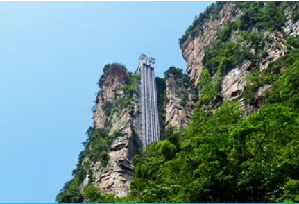
ลิฟท์แก้วไปหลว