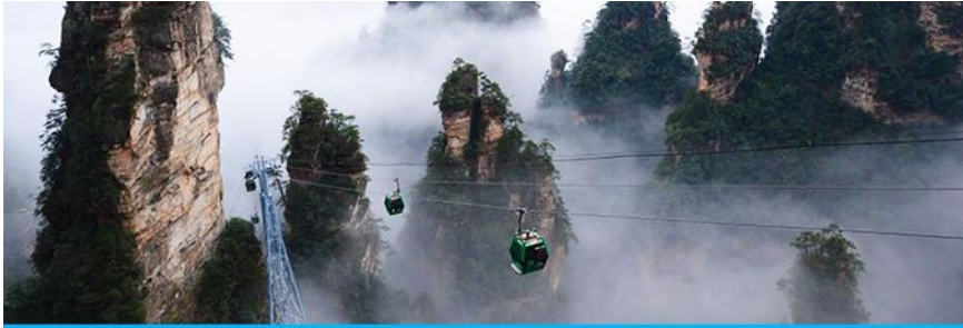
กระเช้าลงจากเขาเทียนจื่อซาน