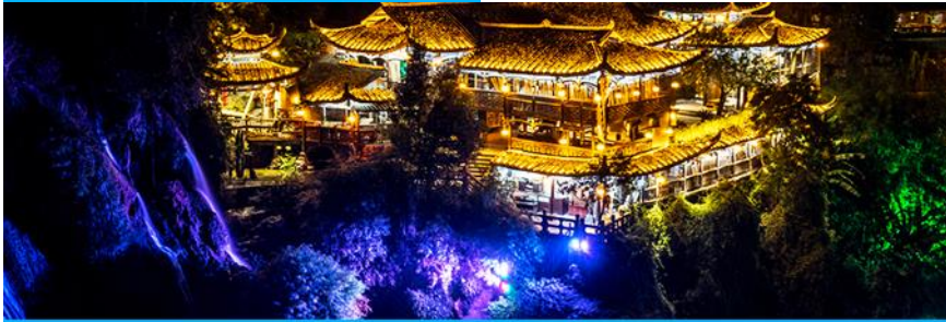
เมืองโบราณฝูหรงเก๋น

วันที่สาม เมืองจางเจียเจี้ย-ตึกมหัศจรรย์ 72 ชั้น-นอนในเมืองเก่าโบราณฝูหรงเจิ้น เต็มอิ่มแสงสี ยามค่ำกิน ออฟชั่นไกด์ขายโปรแกรม เขาเทียนเหมินซาน กระเช้าขึ้นลง ประตูลู่วรรค บันไคเลื่อนทะลุเขา