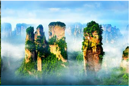
ภูเขาอวตาร

วันที่ 1 เมืองโบราณผู่หรงเจิ้น –จางเจียเจี๋ย –พิพิธภัณฑ์ภาพหินทราย-ชั้นลิฟท์แก้ว เทียนเขาเทียนจื่อซาน (เขาอวตาร) คิ่่นนี้่นอนบนเขา ผังหยวนเจียเจี๋ย