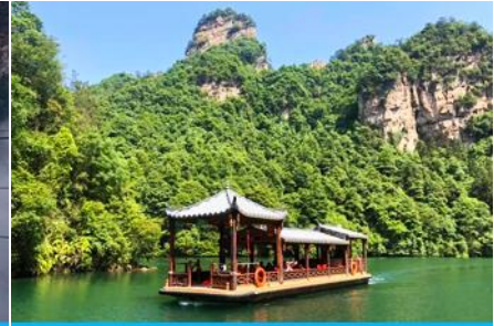
ล่องเรือทะเลสาบ เป่าเฟิงหู

วันที่ห้า ชมพระอาทิตย์ขึ้น-เขาเทียนจื่อซาน(อวตาร) นั่งกระเช้าลงจากเขา-เมืองจางเจียเจี้ย – เลือกซื้อโปรแกรมทัวร์เสริม ออฟชั่น ทะเลสาบเป่าเฟิงหู – เดินทางกลับเมืองหยีซัง