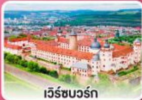
เว็รชบวร์ค