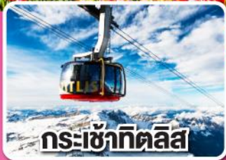
กระเช้าทิตลิส