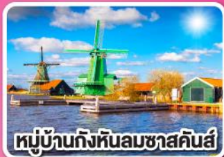
หมู่บ้านกังหันลมชาสคินส์