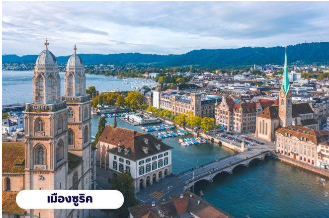
เมืองซูริก

☉ บริการอาหารกลางวัน ณ ภัตตาคารบนยอดเขา จากนั้นนำท่านลงจากยอดเขาและเดินทางต่อไปยัง เมืองซูริก ใช้เวลาเดินทางประมาณ 1 ชั่วโมง นำท่านเที่ยวชม จัตุรัสปาราเดพลาทซ์ (Paradeplatz) จัตุรัสเก่าแก่ที่มีมาตั้งแต่สมัยศตวรรษที่ 17 ในอดีตเคยเป็นศูนย์กลางของการค้าสัตว์ที่สำคัญของเมืองซูริก ปัจจุบันจัตุรัสนี้ได้กลายเป็นชุมทางรถรางที่สำคัญของเมืองและยังเป็นศูนย์กลางการค้าของย่านธุรกิจ ธนาคาร สถาบันการเงินที่ใหญ่ที่สุดในประเทศสวิตเซอร์แลนด์ นำท่านแวะถ่ายรูปกับ โบสถ์ฟรอมุนสเตอร์ (Fraumunster Abbey) จากบนสะพานมุนสเตอร์บรุค เป็นโบสถ์ที่มีชื่อเสียงของเมืองซูริก สร้างขึ้นในปี ค.ศ. 853 โดยกษัตริย์เยอรมันหลุยส์ ใช้เป็นสำนักแม่ชีที่มีกลุ่มหญิงสาวชนชั้นสูงจากทางตอนใต้ของเยอรมันอาศัยอยู่ นำท่านสู่ ถนนบาห์นโฮฟชตราสเซอร์ (Bahnhofstrasse) เป็นถนนอันลือชื่อที่มีความยาวประมาณ 1.4 กิโลเมตร เป็นถนนที่เป็นที่รู้จักในระดับนานาชาติว่าเป็นถนนช้อปปิ้งที่มีสินค้าราคาแพงที่สุดแห่งหนึ่งของโลก ตลอดสองข้างทางล้วนแล้วแต่เป็นที่ตั้งของห้างสรรพสินค้า ร้านค้าอัญมณี ร้านเครื่องประดับ ร้านนาฬิกาและโรงแรมระดับหรู อิสระให้ท่านเดินเล่นและเลือกซื้อสินค้าตามอัธยาศัย ใช้เวลาอันสมควรนำท่านสู่สนามบิน