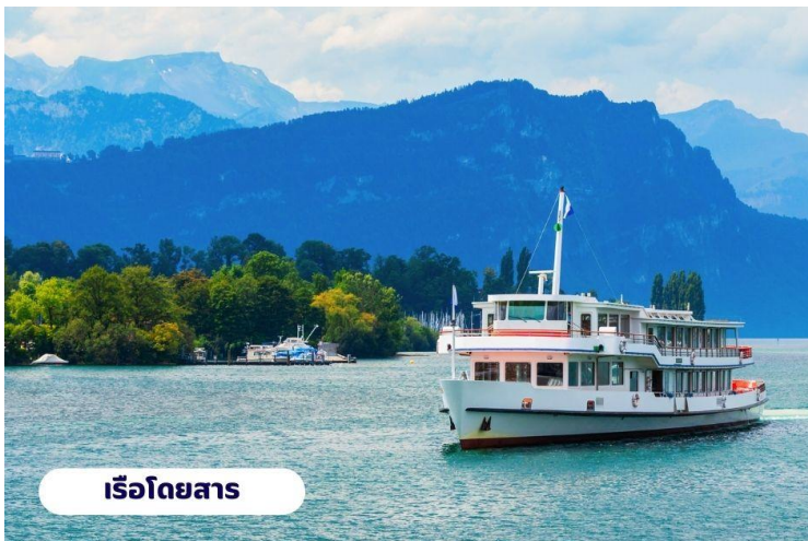
เรือโดยสาร

☉ บริการอาหารเช้า ณ ห้องอาหารของโรงแรม จากนั้นนำท่านเดินทางสู่ ยอดเขาริกิ (Rigi Kulm) โดยใช้การเดินทางโดยเรือจากทะเลสาบลูเซิร์นไปยังท่าเรือวิทซ์เนา (Vitzanu) จากนั้นนั่งรถไฟไต่เขา Rigi ถือได้ว่าเป็นรถไฟไต่เขาที่เก่าแก่ที่สุดในยุโรป และยังเป็นอันดับ 2 รองจากยอดเขาวอชิงตัน ในมลรัฐนิวแฮมป์เชียร์ สหรัฐอเมริกา ความสูงจากระดับน้ำทะเล 1,797 เมตร จนมาถึงยอดเขาริกิ (Rigi Kulm) ที่นี่มีที่มาจากคำว่า Mons Regina แปลได้ว่าราชินีแห่งภูเขา เพราะสามารถมองเห็นทิวทัศน์ของยอดเขาอื่นๆ ได้รอบ 360 องศา ชมวิวแบบพาโนรามาโอบล้อมด้วยธรรมชาติของทะเลสาบ Luzern และ Zug อิสระทุกท่านถ่ายรูปชมวิวดตามอัธยาศัย