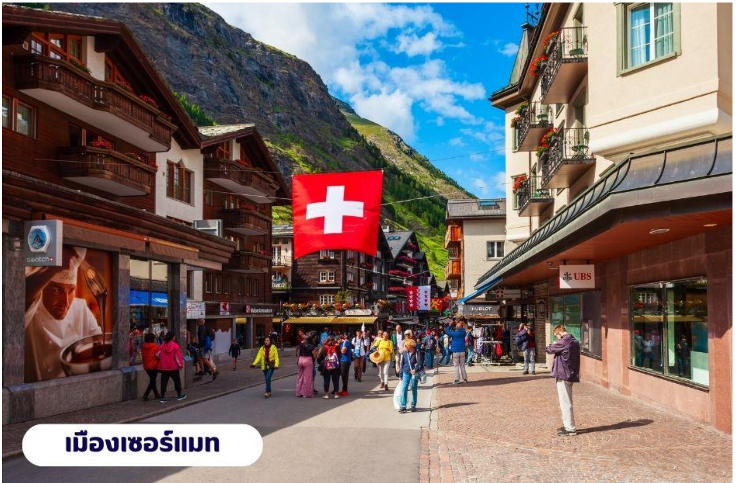
เมืองเซอร์แมท

📍 บริการอาหารเช้า ณ ห้องอาหารของโรงแรม จากนั้นนำท่านเดินทางสู่ เมืองแทสช์ (Tasch) ใช้เวลาเดินทางประมาณ 2.30 ชั่วโมง ตั้งอยู่ในประเทศสวิตเซอร์แลนด์ เป็นประเทศขนาดเล็กที่ไม่มีทางออกสู่ทะเล และตั้งอยู่ในทวีปยุโรปตะวันตก ซึ่งมีเทือกเขาแอลป์ ซึ่งเป็นเทือกเขาที่ใหญ่ที่สุดของทวีปยุโรป และเลียบตามหุบเขา ชมทิวทัศน์สวยอันงดงามตลอดเส้นทาง จากนั้นนำท่านเดินทางโดยรถไฟสู่เมืองเซอร์แมท (Zermatt) ใช้เวลาเดินทางประมาณ 15 นาที โดยรถไฟซึ่งเป็นเมืองที่ไม่อนุญาตให้รถยนต์วิ่งและเป็นเมืองที่ได้รับการยกย่องว่า ปลอดภัยที่สุดในโลกตั้งอยู่บนความสูงกว่า 1,620 เมตร ซึ่งเป็นที่ตั้งของยอดเขาแมทเทอร์ฮอร์น ซึ่งเป็นสัญลักษณ์ของสวิตเซอร์แลนด์ เมืองเซอร์แมทเป็นเมืองเล็กๆ หรืออาจจะเรียกได้ว่าเป็นหมู่บ้านก็ได้ เพราะว่ามีประชากรในเมืองไม่ถึง 10,000 คนทางตอนใต้ของสวิตเซอร์แลนด์ติดกับชายแดนอิตาลี โดยมี Pennine Alps ซึ่งเป็นส่วนหนึ่งของเทือกเขา Alps เป็นเส้นกั้นระหว่าง 2 ประเทศหากพูดถึง Zermatt ก็ต้องนึกถึงยอดเขาแหลมที่มีลักษณะคล้ายปิรามิด ชื่อว่า Matterhorn ที่ตั้งตระหง่านอยู่ใกล้ๆ เมือง มีความสูงถึง 4,478 เมตร สามารถมองเห็นได้จากแทบทุกมุมของเมือง ซึ่ง Matterhorn นี้ถือเป็นสัญลักษณ์ที่สำคัญของ Zermatt