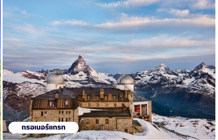
กรอนเนอร์กรัท