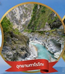
อุทยานทาโรโกะ