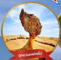
อุทยานเหยหลิว