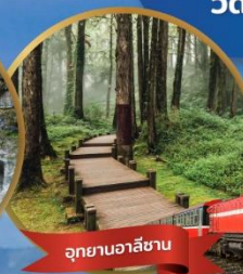
อุทยานอาลีซาน