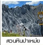
สวนหินปาเหมย์