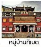
หมู่บ้านทิเบต