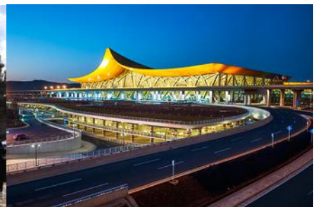
สนามบินเมืองคุนหมิง