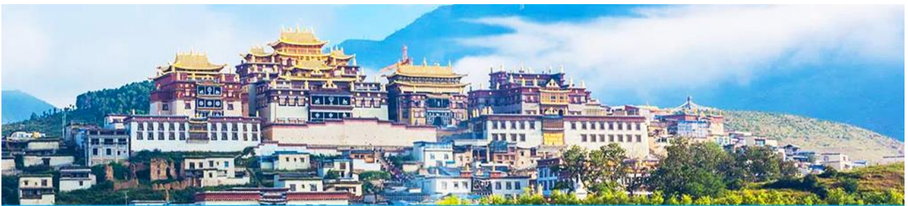
เมืองโบราณแซงกรี่ล่า

จากนั้นนำท่านชม หมู่บ้านซีโจวหรือหมู่บ้านชาวไป๋ ชนพื้นเมืองที่สำคัญของเมือง ชมการแสดงของชนชาติป้ายพร้อมชิมชาสามแก้ว เพื่อรำลึกถึงวิถีชีวิตและการเกิดมาเป็นมนุษย์ของตนเอง ซึ่งถือเป็นเอกลักษณ์ของชนชาวไป๋ที่หาดูได้ยาก