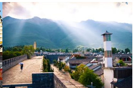
หมู่บ้านซีโจว(หมู่บ้านชาวป๋อ)