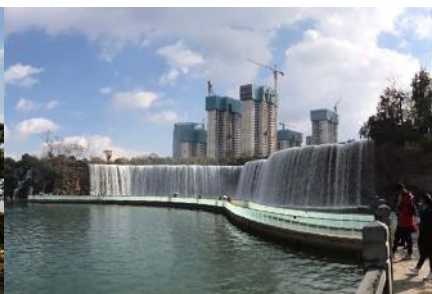
สวนน้ำตก Kunming Waterfall Park