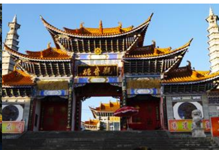
วัดเจ้าแม่กวนอิมเปลงกาย