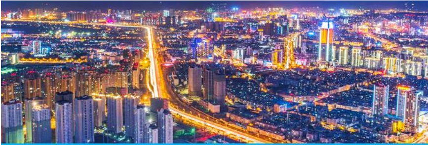
นครคุนหมิง