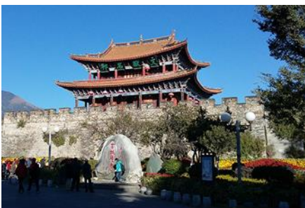
เมืองโบราณต้าลี่