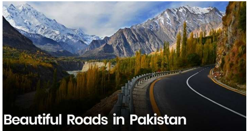
Beautiful Roads in Pakistan

Kohistan และ Shangla ในฤดูร้อน เมืองนี้ยังเป็นศูนย์กลางของนักท่องเที่ยวทั้งในระดับนานาชาติและระดับประเทศที่แวะมาที่นี่ เพื่อเดินทางต่อไปยังพื้นที่ตอนเหนือของปากีสถาน....ตลอดเส้นทางระหว่าง ท่านจะได้ชื่นชมกับความงดงามของธรรมชาติที่ปรากฏบนเส้นทางสายนี้ ชมวิวระหว่างสองข้างทาง.... ถนนที่สวยงามที่สุดในปากีสถาน จากภูมิประเทศอันเขียวชอุ่มไปจนถึงภูเขาสูงตระหง่าน มีถนนที่งดงามหลายสายในปากีสถานที่ใช้เป็นเส้นทางที่มีทัศนียภาพสวยงาม ซึ่งพิสูจน์ได้ว่าบางครั้งการเดินทางก็มีความสำคัญมากกว่าจุดหมายปลายทางเสียอีก