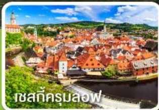
เชสกีครุมลอฟ