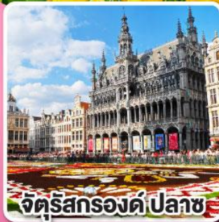
จัตุรัสกรองด์ปลาซ