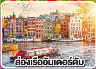
ล่องเรืออัมสเตอร์ดัม