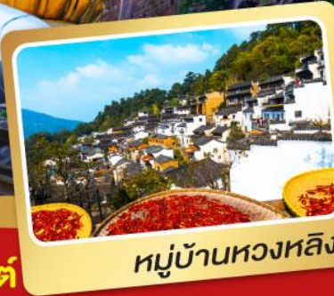
หมู่บ้านหวงหลิง