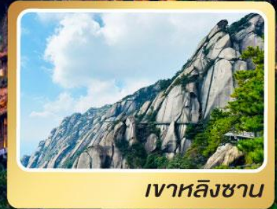
เขาหลิงซาน