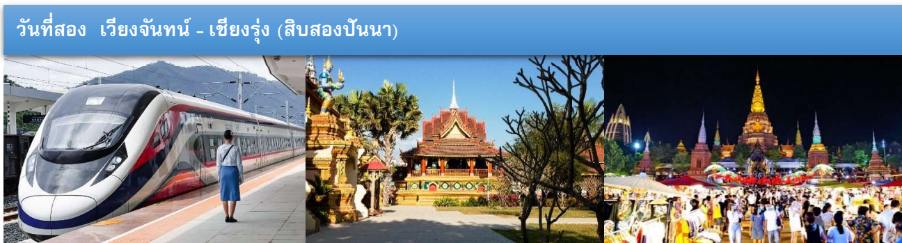
วันที่สอง เวียงจันทน์ - เชียงรุ่ง (สิบสองปันนา)

นำท่านเข้าสู่ Sabaidee @ Lao Hotel หรือเทียบเท่า (N1)