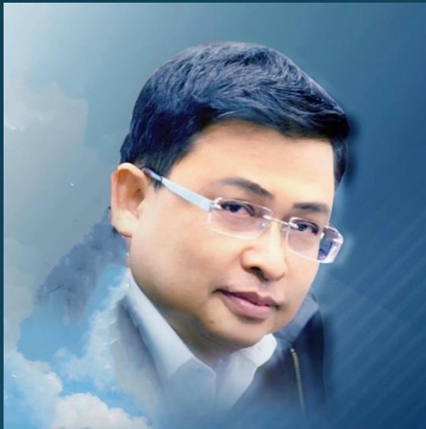
นายมณฑิร เจริญผล รองผู้ว่าการตรวจเงินแผ่นดิน