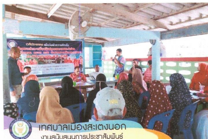
เทศบาลเมืองสะเตงนอก งานสนับสนุนการประชาสัมพันธ์