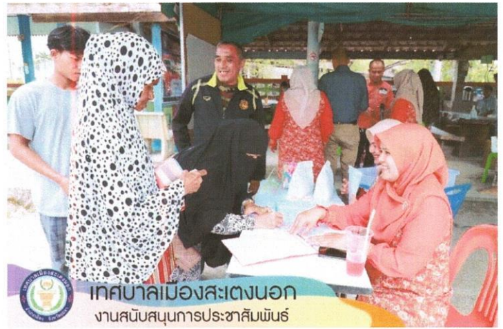
เทศบาลเมืองสะเตงนอก งานสนับสนุนการประชาสัมพันธ์