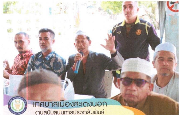
เทศบาลเมืองสะเตงนอก งานสนับสนุนการประชาสัมพันธ์