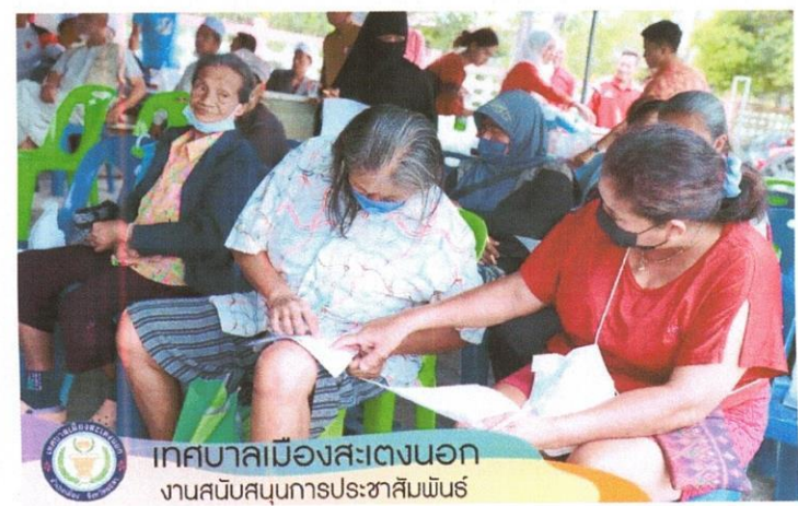
เทศบาลเมืองสะเตงนอก งานสนับสนุนการประชาสัมพันธ์