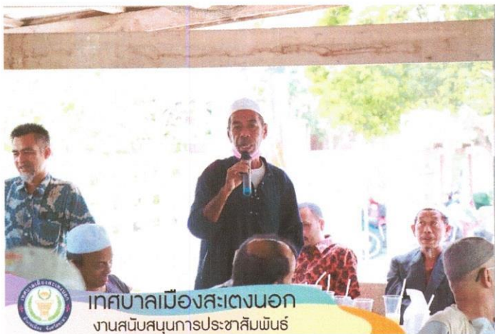
เทศบาลเมืองสะเตงนอก งานสนับสนุนการประชาสัมพันธ์