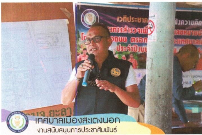
เทศบาลเมืองสะเตงนอก งานสนับสนุนการประชาสัมพันธ์