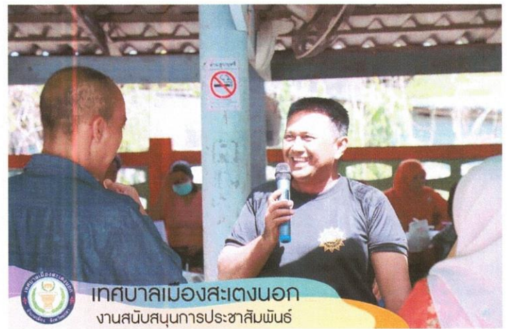
เทศบาลเมืองสะเตงนอก งานสนับสนุนการประชาสัมพันธ์