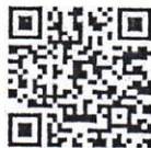
ระบบให้คำปรึกษา