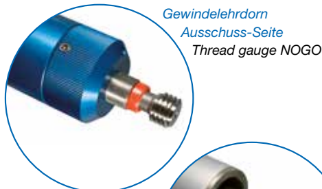
Gewindelehrdorn Ausschuss-Seite Thread gauge NOGO