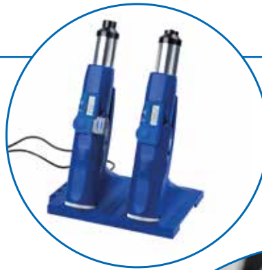
Modulare Ladestation für TD-Gauge+ MOTORIZED Modular charging station for TD-Gauge+ MOTORIZED