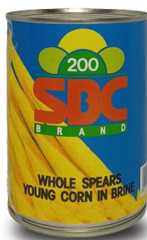
BABY CORN WHOLE IN BRINE ( M ) ข้าวโพดฝักอ่อนในน้ำเกลือ