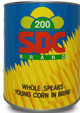
BABY CORN WHOLE IN BRINE ( M ) ข้าวโพดฝักอ่อนในน้ำเกลือ