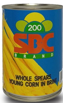
BABY CORN WHOLE IN BRINE ( SS ) ข้าวโพดฝักอ่อนในน้ำเกลือ