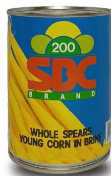
BABY CORN WHOLE IN BRINE ( Y22 ) ข้าวโพดฝักอ่อนในน้ำเกลือ