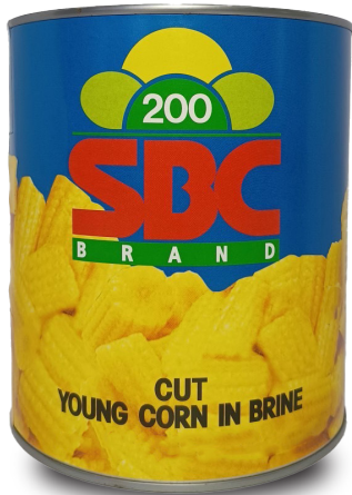
BABY CUT CORN IN BRINE ( S ) ข้าวโพดฝักอ่อนในน้ำเกลือ (ก่อน)